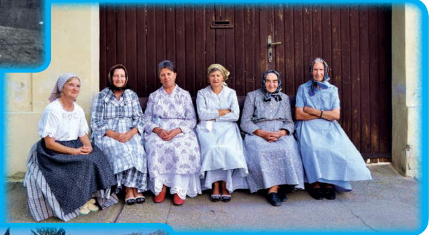
Bunjevke u svagdanjoj odjeći 2011. godine

Garski Bunjevci ponosni su na svoje folklorne skupine koje imaju bogatu povijest (onomad u suradnji s našim suseljani- nom, slavnim koreografom, pokojnim Antunom Kričkovićem), a