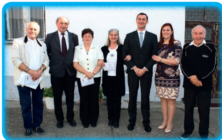
Zastupnici Hrvatske samouprave Bačko-kiškunske županije

Početak 1995. utemeljuju se mjesne hrvatske samouprave, a još iste godine i posredno izabrana Hrvatska državna samouprava. Od 2006. u županijama s najmanje deset, zatim devet utemeljenih mjesnih samouprava osnivaju se i hrvatske samouprave na županijskoj razini. Na posljednjim izborima za mjesne i županijske te državnu hrvatsku samoupravu, u listopadu 2019. godine utemeljeno je 116 mjesnih hrvatskih samouprava. Hrvati u Bačko-kiškunskoj županiji utemeljili su 13 mje-