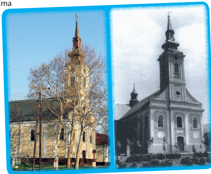
Garska rimokatolička crkva

Od 2010. godine u selu djeluje i Romska samouprava. Najvažniji događaji u organizaciji garske Hrvatske samouprave jesu Bunjevačko prelo, Muško prelo, Narodnosno-gastronomski dan, Materice i Oci, te paljenje svijeće na adventskom vijencu. Materice i Oci blagdan su bunjevačkih Hrvata, koji ne slave svoje majke u svibnju, nego u prosincu, treće nedjelje došašća. U to adventsko doba pada crkvena svetkovina, čekanje porođenja Isusa Krista. Isus je svojim rođenjem još jednom posvetio veliku ulogu majke i oca u životu djece. Nekada je to bio važan obiteljski svetak, kada su djeca slavila ne samo svoju mamu nego i bake, tetke i sve ženske članove u rodbini. Išli su slaviti po kućama kod rodbine, a proslavljene žene su ih darivale