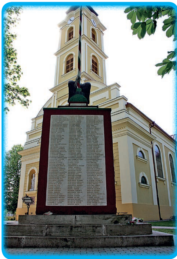
Crkva u Aljmašu sa spomenikom palima u svjetskim ratovima

Nakon pokretanja društvenog i kulturnog života poslije Drugoga svjetskog rata i zastoja zbog nepovoljnoga političkog okruženja 1950-ih i 1960-ih godina, tijekom 70-ih i 80-ih godina opet je živnuo društveni i kulturni život bačkih Hrvata. U najvećim naseljima organiziraju se neformalni „južnoslavenski“, bunjevački i šokački klubovi. Do danas su se očuvali Bunjevački „Divan klub“ u Aljmašu, utemeljen 1972. godine, a od 2006. godine djeluje kao Neprofitna udruga bunjevačkih Hrvata, te Državna udruga šokačkih Hrvata u Santovu (od 1990.) čiji je rad prije dvije godine obnovljen, otada i živnuo kroz razna okupljanja i priredbe. Krajem 80-ih godina prošloga stoljeća obnavlja se rad Bajske bunjevačke katoličke čitaonice (1988.), kojoj je početkom 90-ih vraćena i zgrada udruge, utemeljene 1909. godine, pod nazivom Hrvatski kulturni centar „Bunjevačka čitaonica“. Nažalost, ova je udruga prije nekoliko godina izgubila svoj hrvatski predznak, postala je bunjevačka odnosno kršćanska čitaonica. Osnivaju se hrvatske udruge, kulturna društva i orkestri koji djeluju i danas: KUD „Rokoko“ (Čikerija, 1984.), Orkestar „Čabar“ (Baja, 1986.), Tamburaški sastav „Bačka“ (Gara, 1990.), HKUD „Vodenica“ (Baćino, 1999.), KUD „Bunjevačka zlatna grana“ (Baja, 2005.) kao nasljednica Plesnoga društva Bajske bunjevačke čitaonice (1972.), KUD „Gara“ (Gara, 1999.), Kulturna udruga bunjevačkih Hrvata u