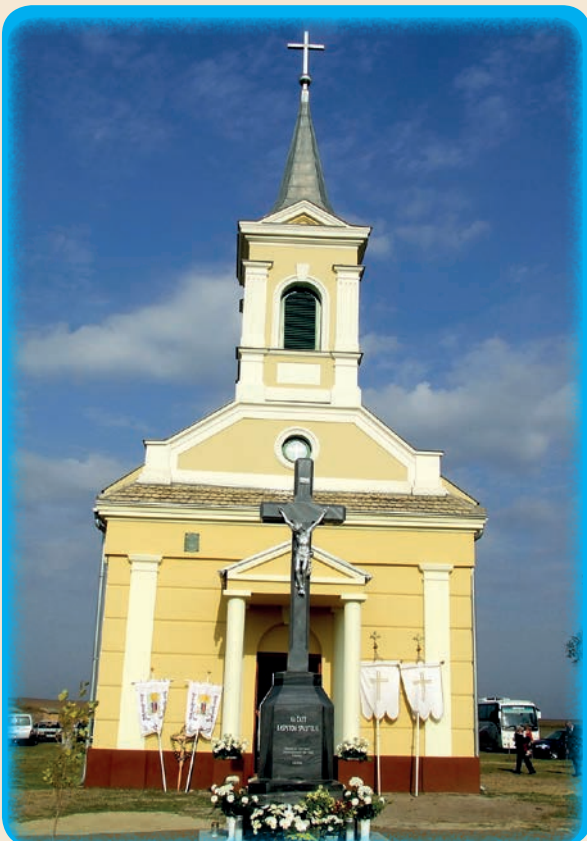
Obnovljena kačmarska kapelica, podignut križ u čast Raspetog Spasitelja

Na poticaj mjesne Hrvatske samouprave, a u suorganizaciji sa Santovačkom župom, 2010. godine pokrenuti su Vjerski susreti i hodočašća bačkih Hrvata, te prijateljskih hrvatskih zajednica iz Vojvodine (Srbije) i Hrvatske, koji pridonose duhovnom obogaćivanju Gospina svetišta na santovačkoj Vodici.