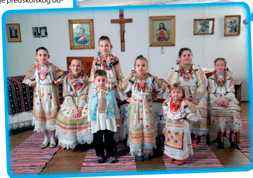
Santovačka djeca u izvornoj nošnji

po ugovoru s mjesnom samoupravom na održavanje preuzima Hrvatska državna samouprava. Nakon toga dolazi do znatnog pomaka u radu, već 2001. do podjele do tada spojenih nižih razreda (1.-3., 2.-4.) na posebne skupine, kasnije pak i do razdvajanja miješanih skupina u vrtiću. Obnovljenim ugovorom sa santovačkom Seoskom samoupravom 1.