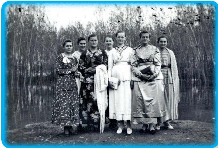
Garske Bunjevke početkom 40-ih godina 20. stoljeća

orasima, jabukama i novčićima. Slično je to bilo i na šibare, nakon Božića. Četvrte nedjelje došašća su se slavili Oci, tj. muški članovi obitelji. Bitni obiteljski događaji i okupljanja još su bila proštenja, svinjokolje, žetva i berba. Seosko proštenje nekada se slavilo jedinstveno, po danu zaštitnika crkve, svetom Ladislavu, u lipnju.