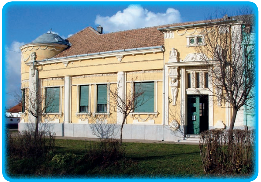
Zgrada bivše „Bunjevačke škole“ u Kaćmaru

Nakon demokratskih promjena u Mađarskoj potkraj 1980-ih godina živnuo je i društveno-politički život Hrvata u Mađarskoj. Hrvatska zajednica u Mađarskoj danas je organizirana kroz civilne udruge i hrvatske narodnosne samouprave na mjesnom, područnom i državnom nivou.