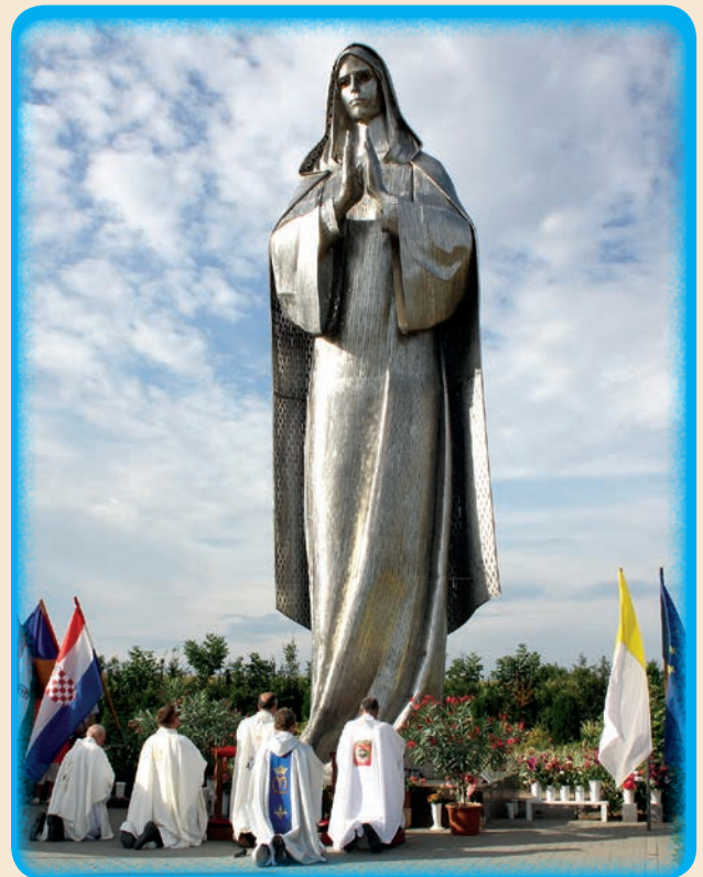
Velebni Gospin kip postavljen 2008. godine