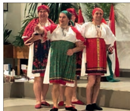
Regionalni hrvatski bal u Barči