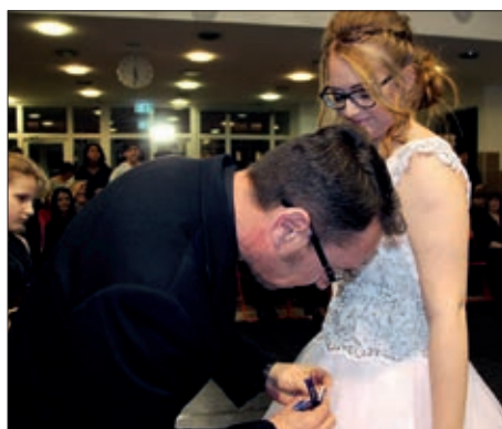
Predaja maturálnih vrpca u HOŠIG-u