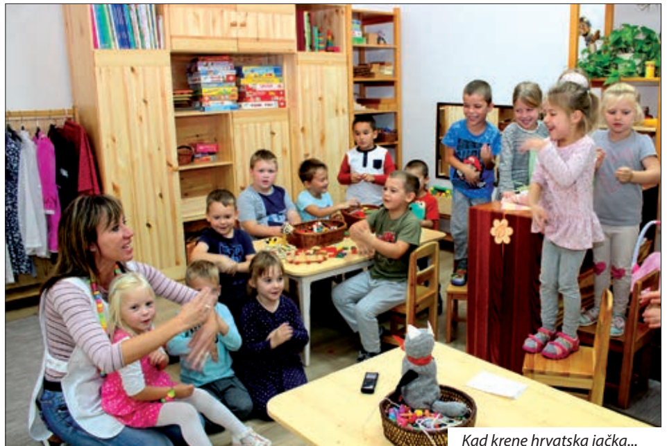
Kad krene hrvatska jačka...