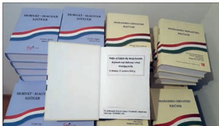
Poklon: rječnik hrvatsko-mađarskog i mađarsko-hrvatskog jezika