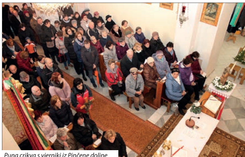
Puna crkva s vjernici iz Pinčene doline