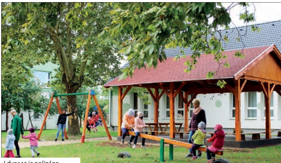
I dvor se je polipšao