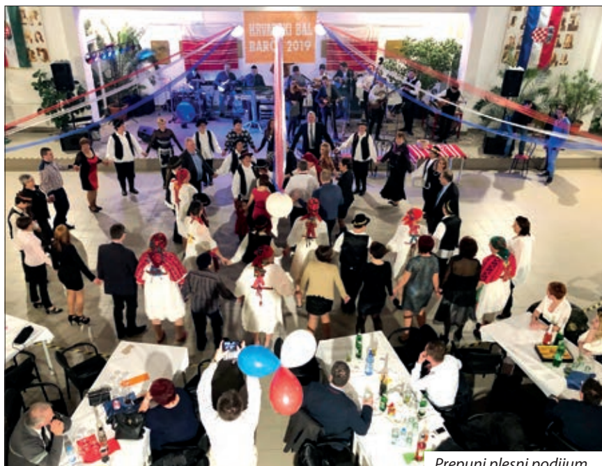
Prepuni plesni podijum