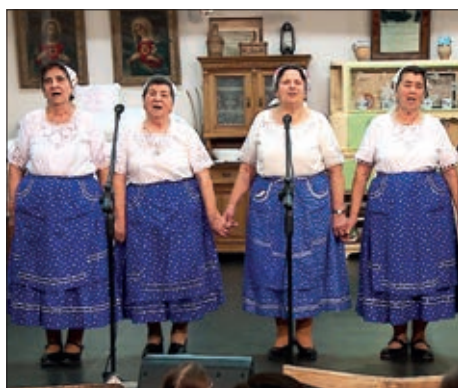
Prelo u Dušniku