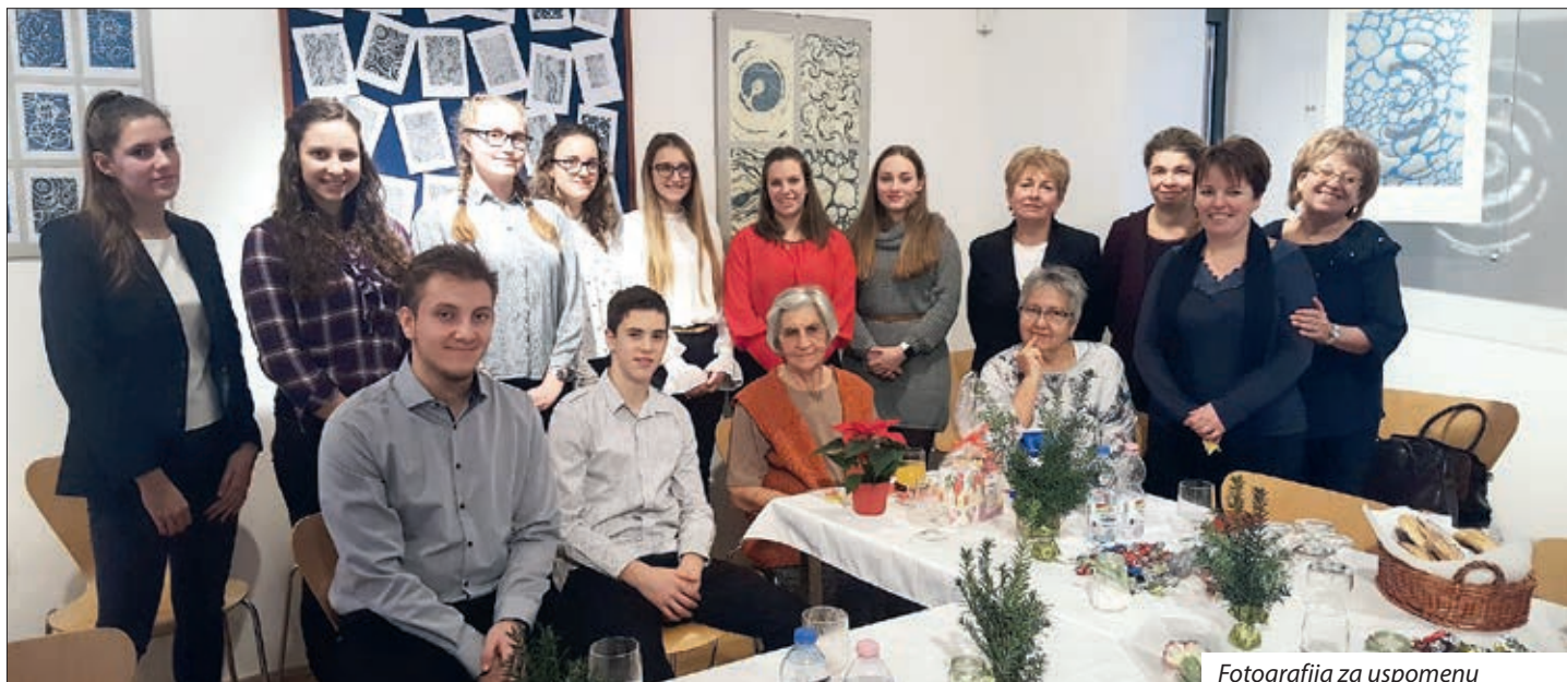
Fotografija za uspomenu

Prije dvadeset i pet godine utemeljena je Zaklada „Za buduću hrvatsku (šokačku) inteligenciju“ koja od tada pomaže učenike na srednjim i visokim školama te studente na fakultetima koji su nakon završetka školovanja voljni raditi na prosvjetnom i kulturnom uzdizanju domaćega hrvatskog stanovništva i čuvati njegovu samobitnost. Tu je zamisao imao i Matija Kovačić, pokretač ove hrvatske zaklade u Mohaču. Godine 1994. tada umirovljeni učitelj, danas pokojni Matija Kovačić utemeljio je Zakladu „Za buduću hrvatsku (šokačku) inteligenciju“.