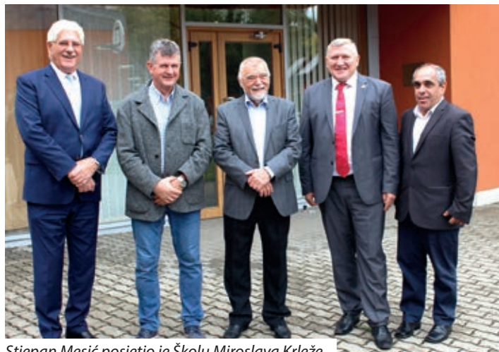
Stjepan Mesić posjetio je Školu Miroslava Krležu.

Prostor Balkana je li danas još uvijek prostor žarišta, Balkan izvan EU-a, je li EU taj prostor želi za sebe, pitali smo Stjepana Mesića.