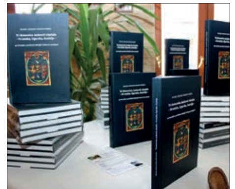
Tri domovine Janković vlastela