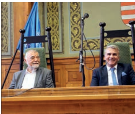
Stjepan Mesić u Pečuhu