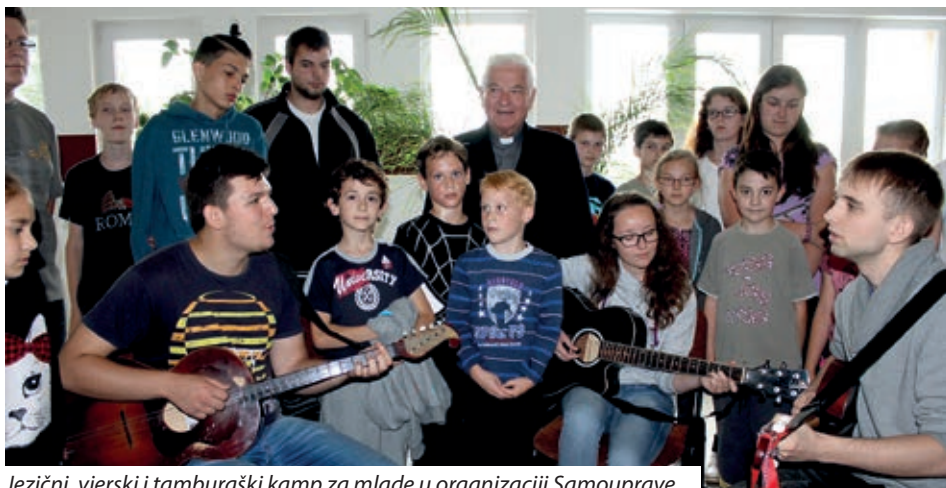
Jezični, vjerski i tamburaški kamp za mlade u organizaciji Samouprave