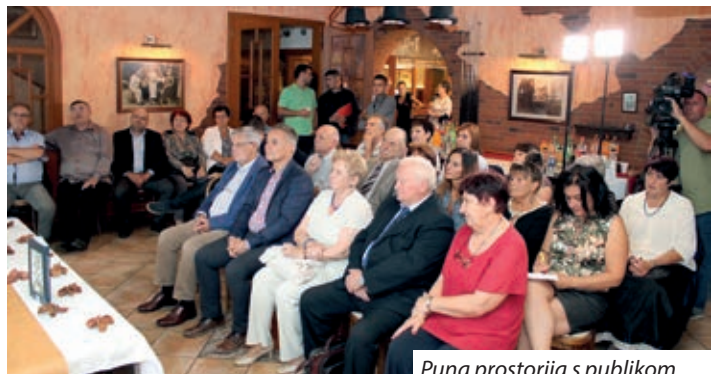
Puna prostorija s publikom