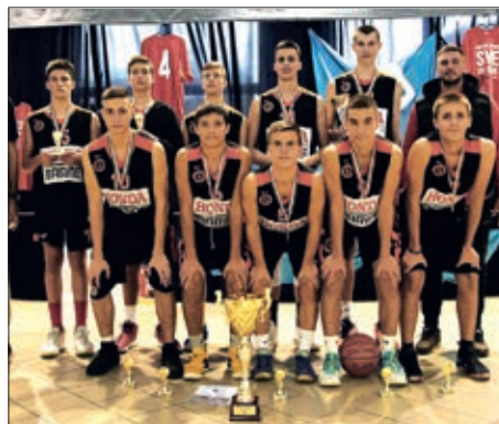
II. Memorijalni košarkaški turnir