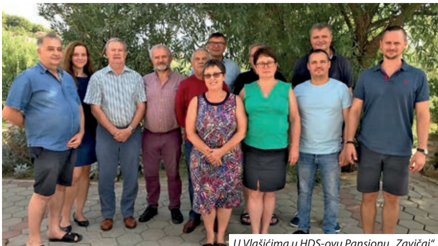
U Vlašićima u HDS-ovu Pansionu „Zavičaj“

Na poziv predsjednika Hrvatske državne samouprave Ivana Gugana, od 16. do 18. rujna 2019. u Kulturno-prosvjetnom centru i odmaralištu u Vlašićima, na otoku Pagu, održana je završna sjednica mandata Saveza državnih narodnosnih samouprava, na kojoj se ocijenio petogodišnji rad i aktualna situacija glede pitanja kako i u kojoj mjeri dolaze do izražaja prava narodnosti. Na poziv predsjednice Saveza Erzsébet Rácskó, uza zamjenicu pravobraniteljicu narodnosnih prava dr. Erzsébet Sándor Szalay, u Centar su doputovali i narodnosni savjetnik Glavnog odjela za narodnosnu opću prosvjetu pri Ministarstvu ljudskih resursa István Kraszlán, te šestero predsjednika državnih narodnosnih samouprava i njihovi suradnici, odnosno narodnosni glasnogovornici. Sudionici su pregledali aktivnosti Saveza državnih narodnosnih samouprava u proteklih pet godina, posebno analizirajući uspjehe i daljnje mogućnosti na području zastupanja, zagovaranja prava nacionalnih manjina, promjene u sustavu financiranja, izazove glede preuzimanja ustanova, te položaj odgojno-obrazovnih ustanova. Zamjenica pravobraniteljica narodnosnih prava u svom je izlaganju „Iskustva u suradnji pravobraniteljice narodnosnih prava s državnim narodnosnim samoupravama“ predstavila šestogodišnji tuzemni i inozemni pravobraniteljski rad. Narodnosni savjetnik István Kraszlán pak je u svome predavanju „Narodnosna opća prosvjeta – ishodi, perspektive“ priopćio vladine uredbe u proteklim godinama.