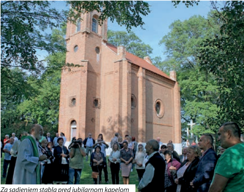
Za sadnjem stabla pred jubilarom kapelom

U čast 150. obljetnice gradnje kapele van grada Čeprega, posvećenoj Blaženoj Divici Mariji, 14. septembra, u subotu, u okviru Dana Hrvatov prva štacija svetka je dopeljala u prirodu mnoštvo