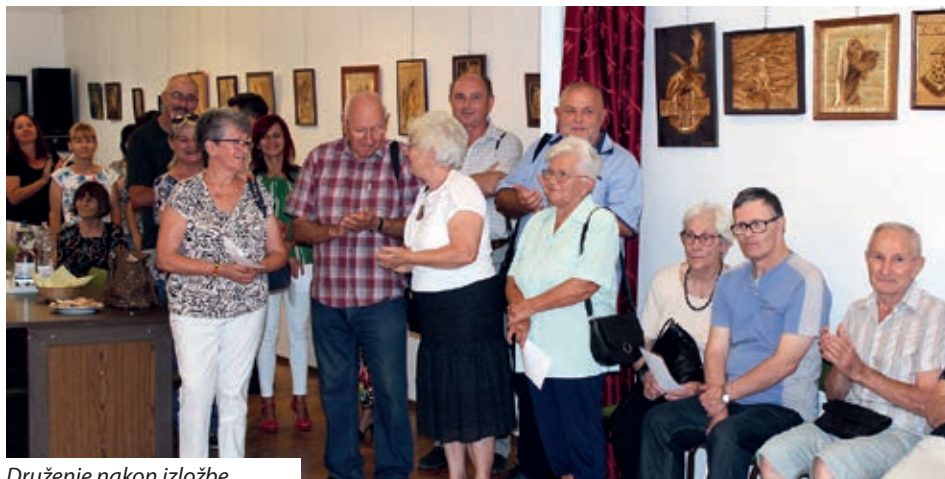
Druženje nakon izložbe