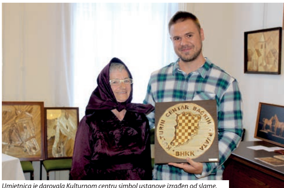
Umjetnica je darovala Kulturnom centru simbol ustanove izrađen od slame.

U organizaciji Kulturnog centra bačkih Hrvata, 4. rujna, u županijskom Domu narodnosti u Baji otvorena je izložba slika od slame.