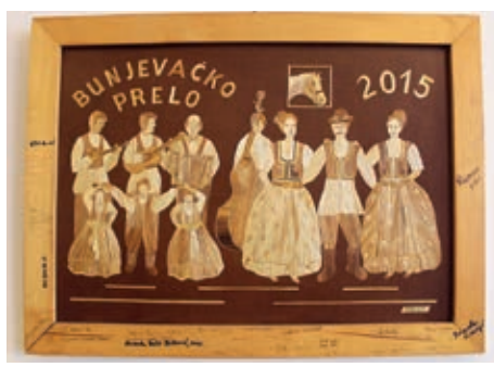
Slika Bunjevačko prelo

Pošto je svoje radove prijavila Lektora-