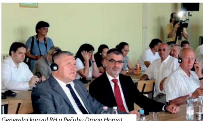
Generalni konzul RH u Pečuhu Drago Horvat

Nazočne su osim drugih pozdravili Róbert Zsigó, državni tajnik za nadzor prehrambenog lanca pri Ministarstvu poljoprivrede, parlamentarni zastupnik bajske regije, István Pásztor, predsjednik Skupštine AP Vojvodine, koji su naglasili potrebu i važnost Trojnog susreta i regionalne gospodarske suradnje.