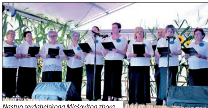
Nastup serdahelskoga Mješovitog zbora

Za natjecanje se kandidiralo ukupno 10 skupina iz Serdahela, Ostrognje, Podravine, Donje Dubrave, Donjeg Vidovca, čije je poslastice u trima kategorijama ocijenilo stručno povjerenstvo na čelu s Józsefom Prykrilom. Prema njihovoj ocjeni, u kategoriji