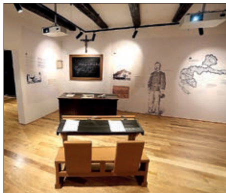
„Kuća Petra Preradovića“