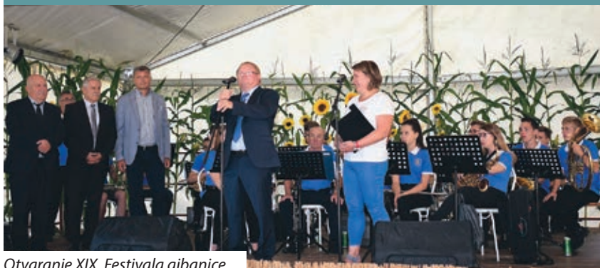
Otvaranje XIX. Festivala gibanice

Gibanica je bila neizostavna poslastica na blagdanskim stolovima pomurskih Hrvata, a danas je jedna od turističkih atrakcija sela Serdahela, odnosno pomurskih Hrvata, što dokazuje i mnoštvo posjetitelja i sudionika XIX. Festivala gibanice, održane 3. kolovoza u Serdahelu. Na radost organizatora, na ovogodišnjem je Festivalu predstavljena gibanica još jedne naše hrvatske regije – Podravine. Među mnogobrojnim gostima našli su se i Péter Cseresnyes, zamjenik ministra inovacije i parlamentarni zastupnik, Ivan Guban, predsjednik Hrvatske državne samouprave, Csaba Bene, dopredsjednik Skupštine Zalske županije, Josip Grivec, zamjenik župana Međimurske županije, i mnogi načelnici s jedne i druge strane granice.