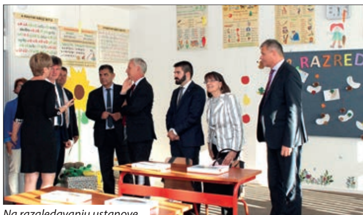
Na razgledavanju ustanove

naroda, a to je posebno izraženo kod pripadnika nacionalnih manjina, pa tako i kod Hrvata koji žive u Mađarskoj. Velika je vrijednost učenja i poučavanja hrvatskoga jezika za očuvanje i razvijanje hrvatskoga identiteta, a toliko je važan rad i s djecom i mladima", dodaje još hrvatski političar ki svoje izlaganje završi s riječi Mate Meršića Miloradića: „Hrvati, vi ne samo da imate pravo slobodno reći da ste Hrvati već je to i vaša sveta dužnost!“ Državni tajnik Miklós Soltész spomene, kako je Vlada Ugarske dala za obnovu ove zgrade 165 milijun forntov u više faza, obećavajući naravno i daljnju potporu za sambotelšku ustanovu. Državna tajnica Zdravka Bušić posebno pohvali dudu ka tako prekrasno pjevaju i govore hrvatski i ganutljivo reče, da nosi u srcu sve Hrvate izvan granic, a školi zaželji puno uspjeha, na ponos Hrvatske i domovine Ugarske. Gradonačelnik Sambotela dr. Tivadar Puskás otpelja nazočne u svojem svečanom govoru u prošlost, sve do 21. septembra 2012. ljeta, kad su skupadošli predstavnici Hrvatov i raspravljali se o utemeljenju Hrvatskoga školskoga centra u Sambotelu. Posebna zahvala je upućena pečuškoj hrvatskoj ustanovi da je 2016. prigrlila kot podružnicu sambotelšku ustanovu, a s tim je mogla krenuti hrvatska čuvarnica kot i