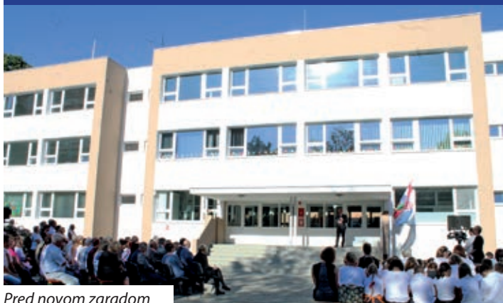
Pred novom zgradom

U nazočnosti zmožne hrvatske diplomacije i visokih dužnosnika ugarske politike ter hrvatskoga političkoga i društvenoga zastupništva, prošloga utorka je u otpodnevni ura svečano prikdan Hrvatski obrazovni centar Mate Meršić Miloradić u Sambotelu, u održavanju Hrvatske državne samouprave. Ujedno je otvoreno i novo školsko ljeto 2019./2020. Ustanova ka je bila od 2016. ljeta podružnica Hrvatskoga vrtića osnovne škole, gimnazije i učeničkoga doma Miroslava Krležu u Pečuhu, u ovoj obnovljenoj zgradi konačno je krenula prema samostalnosti.