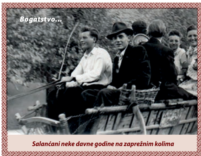
Salančani neke davne godine na zaprežnim kolima