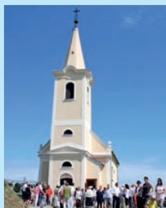
Pred crkvom sv. Martina