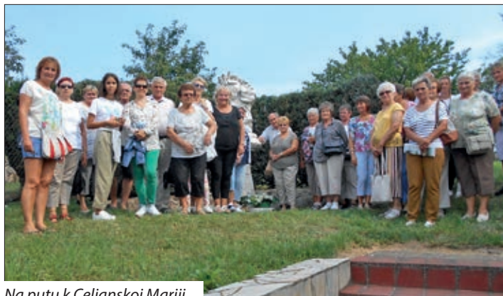
Na putu k Celjanskoj Mariji