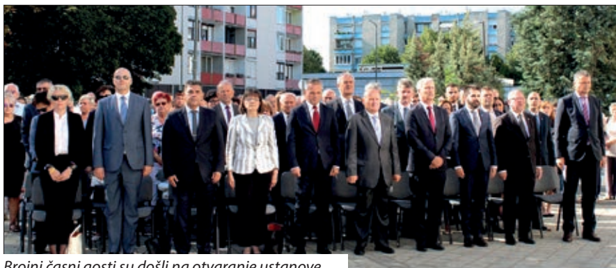
Brojni časni gosti su došli na otvaranje ustanove

to ne smijemo zapustiti. Zahvaljujemo svim Hrvatima koji ovdje žive i svima prijateljima što su nam dali priliku dokazati se. Našu ustanovu obilježava obiteljska atmosfera, visoko stručno znanje i tolerancija. Upravo u tom duhu želimo djelovati“, veli domaćica ustanove i prikduje rič časnim gostom. Državni tajnik Zvonko Milas uz riči zahvale izražava svoju radost da su Hrvati zapadnoga dijela Ugarske dobili obrazovnu ustanovu sličnu onim kakove jur postoju u Budimpešti, Pečuhu i Santovu. „Kvaliteta i dostupnost obrazovanja ima iznimnu važnost za razvoj svake države, svakoga društva i svakoga