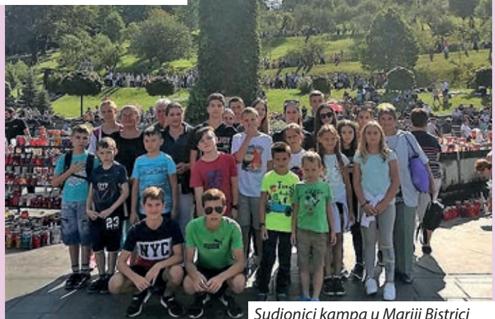
Sudionici kampa u Mariji Bistrici