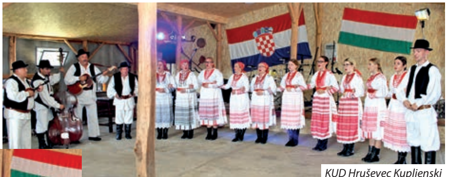
KUD Hruševac Kupljenski

Zajedništvo i složnost potribuju velika, ali i mala sela, tako je svaki put zvanaredna prilika kad stanovnici moru skupadojti, veseliti se, pogostiti svoje prijatelje, kad zato imaju volju i želju. Ovoljetni seoski dan u Hrvatski Šica dobio je 10. augustuša, u subotu, otpodne hrvatski naglasak i zavolj maše zadušnice u čast bivšega farnika Hrvatskih Šic, Józsefa Vizyja, povodom 25. obljetnice njegove smrti, ku je na hrvatskom jeziku