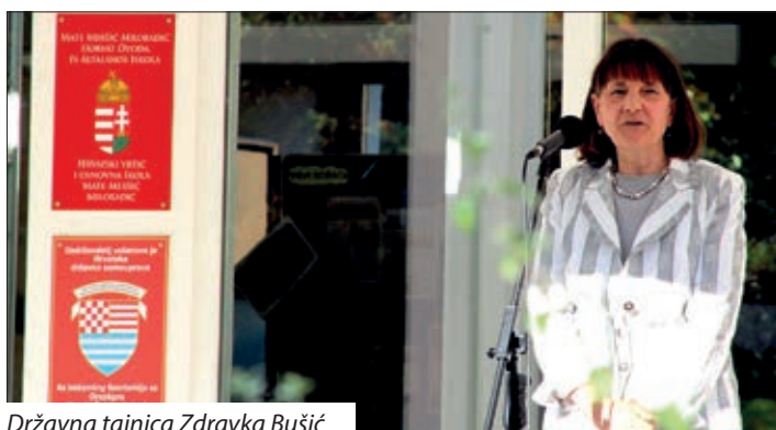
Državna tajnica Zdravka Bušić

naroda, a to je posebno izraženo kod pripadnika nacionalnih manjina, pa tako i kod Hrvata koji žive u Mađarskoj. Velika je vrijednost učenja i poučavanja hrvatskoga jezika za očuvanje i razvijanje hrvatskoga identiteta, a toliko je važan rad i s djecom i mladima", dodaje još hrvatski političar ki svoje izlaganje završi s riječi Mate Meršića Miloradića: „Hrvati, vi ne samo da imate pravo slobodno reći da ste Hrvati već je to i vaša sveta dužnost!“ Državni tajnik Miklós Soltész spomene, kako je Vlada Ugarske dala za obnovu ove zgrade 165 milijun forntov u više faza, obećavajući naravno i daljnju potporu za sambotelšku ustanovu. Državna tajnica Zdravka Bušić posebno pohvali dudu ka tako prekrasno pjevaju i govore hrvatski i ganutljivo reče, da nosi u srcu sve Hrvate izvan granic, a školi zaželji puno uspjeha, na ponos Hrvatske i domovine Ugarske. Gradonačelnik Sambotela dr. Tivadar Puskás otpelja nazočne u svojem svečanom govoru u prošlost, sve do 21. septembra 2012. ljeta, kad su skupadošli predstavnici Hrvatov i raspravljali se o utemeljenju Hrvatskoga školskoga centra u Sambotelu. Posebna zahvala je upućena pečuškoj hrvatskoj ustanovi da je 2016. prigrlila kot podružnicu sambotelšku ustanovu, a s tim je mogla krenuti hrvatska čuvarnica kot i