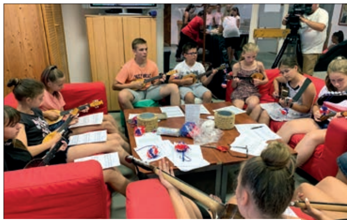
Tamburaška sekcija, prijedpodnevni sat instrumentalne glazbe

Kamp je organiziran u matičnoj domovini, u Vlašićima na otoku Pagu, od 24. do 29. lipnja, u Kulturnom-prosvjetnom centru i odmaralištu Hrvata u Mađarskoj. Tijekom jednodnevnoga kampa djeca su mogla birati među raznim aktivnostima, osim svakodnevnih sati podučavanja tambure i plesa. Petnaestero polaznika sudjelovalo je tamburaškoj, a petnaestero plesnoj sekciji. Bilo je tako mogućnosti i za kreativne radionice i za učenje i vježbanje hrvatskoga jezika, učenje pjesama i metodike pjevanja tradicionalnih pjesama, koja se strogo veže uz narodnu glazbu, folklor,