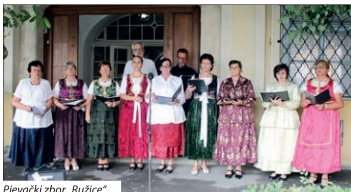
Pjevački zbor „Ružice“

men-ploče biskupu Ivanu Antunoviću, koje je uljepšao domaći pjevački zbor „Ružice“, u pratnji garskog orkestar „Bačka“.