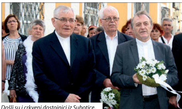
Došli su i crkveni dostojnici iz Subotice.