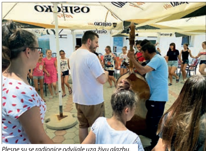
Plesne su se radionice odvijale uz živu glazbu.

Hrvatski kulturni i sportski centar „Josip Gujaš Džuretin“ jest ustanova posvećena očuvanju, održavanju, razvoju i prikazu kulturnih tradicija intelektualne, kulturne baštine hrvatske nacionalnosti. Osigurava sportski prostor za hrvatsku narodnost, koja neprekidnom provedbom svojih zadaća ujedinjuje kulturne smjerove hrvatske nacionalnosti. Centar sudjeluje u proširenju kulturnog i sportskog potencijala hrvatskih naselja. Osnovna je djelatnost istraživanje i promicanje intelektualnih, umjetničkih vrijednosti i bogatstva hrvatskoga jezika, te briga o kulturnim vrijednostima. Uvođenje vrijednosti sveopće, nacionalne i nacionalne kulture. Kulturni centar surađuje s ostalim narodnosnim, državnim i drugim inozemnim kulturnim ustanovama, organizacijama i drugim kulturnim središtima.