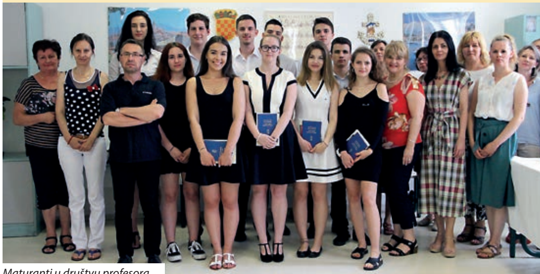
Maturanti u društvu profesora