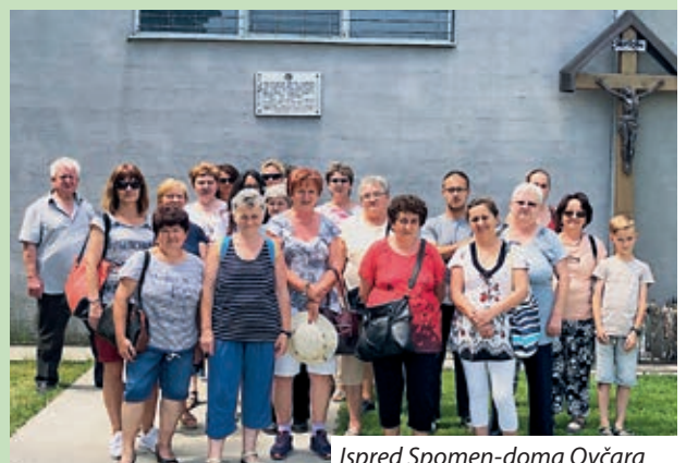
Ispred Spomen-doma Ovčara

Krenuvši iz Vukovara prema Lotaru, stalo se još i u Osijeku na malo razgledanje i da svatko može potrošiti još zadnje preostale kune, pa se put nastavljao prema domovima. Lotarska je Hrvatska samouprava sve putnike ugostila večerom nakon dugačkog i pretoplog dana, u surdukinjskoj gostionici, gdje se nudila mogućnost za daljnje druženje i razgovore o viđenome. Svi su se putnici umorno, ali prepuni doživljaja vratili svojim domovima.