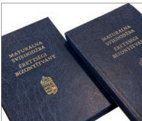
Dvojezična maturalna svjedodžba