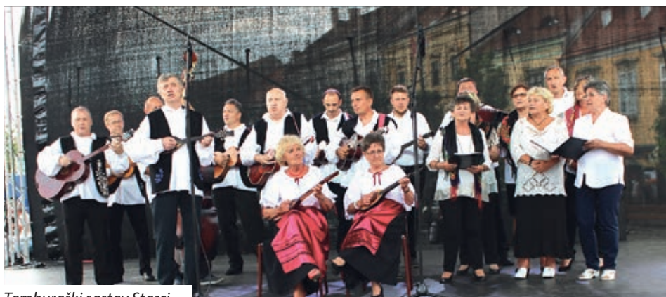
Tamburaški sastav Starci