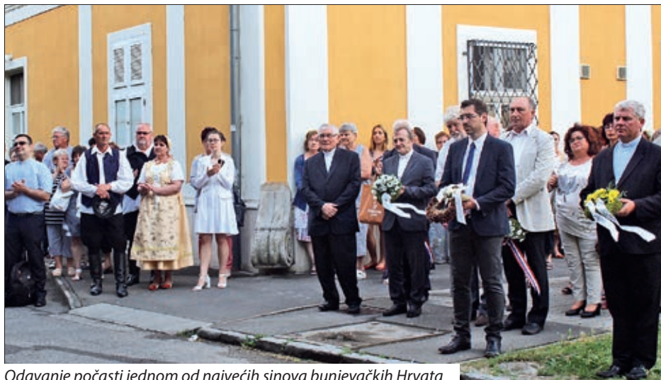
Odavanje počasti jednom od najvećih sinova bunjevačkih Hrvata