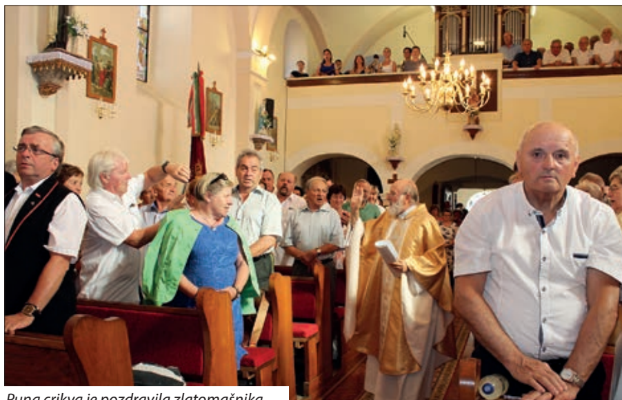
Puna crkva je pozdravila zlatomašnika