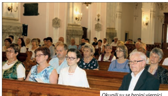
Okupili su se brojni vjernici.