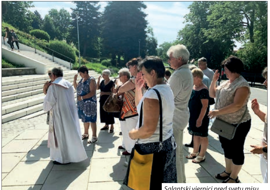
Salantski vjernici pred svetu misu

Svetkovinu Presvetoga Trojstva, 16. lipnja, vjernici Donjomiholjačkog dekanata i susjedne