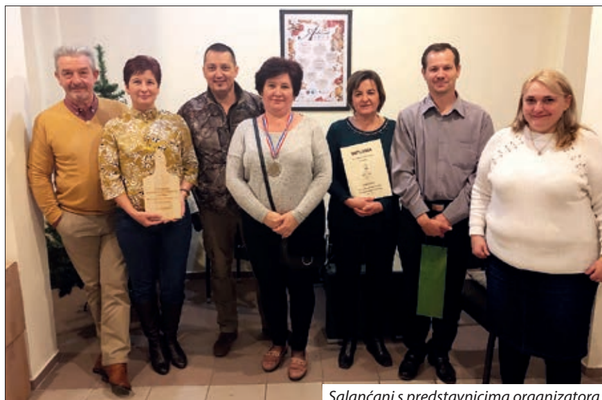
Salančani s predstavnicima organizatora

Udruga Baranjskih Hrvata, kao i lani, 8. prosinca 2018. godine priredila je II. Županijski kulturni i gastronomski festival u Mišljenu. Od 13 sati su se okupile prijavljene družine, koje su se natjecale u nadijevanju kobasica. Na natječaj se registriralo ukupno 14 družina nadjevača koji su pristigli iz okolnih naselja (Vršenda, Narad, Kozar, Semelj, Salanta...), ali su se prijavile i one iz barčanske „Podravine“ te družina s otoka Paga. Udruga je osigurala svakoj družini pet kila mljevena mesa, što su članovi preradili po svom ukusu, toliko paprike i češnjaka stavili unutra koliko su navikli. Za dobar ugođaj tijekom nadijevanja brinuo se Orkestar Orašje, koji je cijelo popodne razdragano pjevao i svirao, često skupa sa članovima drugih družina. Kobasice se nadijevahu na raznorazne načine, od najsuvremenijih uređaja do starih ručnih punilica kojima su se koristili Podravci. Ocjenjivanje kobasica pripalo je peteročlanom povjerenstvu, koje je tražilo po komad punjene i pečene kobasice. Družine su to predale na šarolik način, svaka je okitila tanjur povrćem, paprikom, kruhom i na razne načine, da bi privukle još veću pozornost na kobasice. Povjerenstvo se sastojalo od Miše Udvarca, Miše Šarošca, Lacija Kovača, Antala Solge, koji je do-