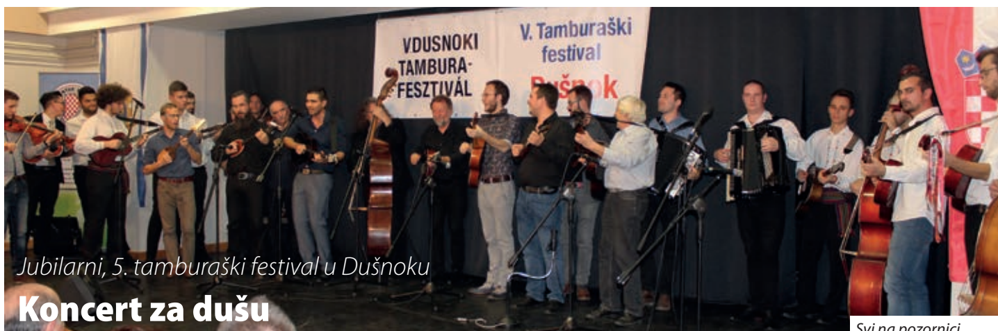
Jubilarni, 5. tamburaški festival u Dušnoku