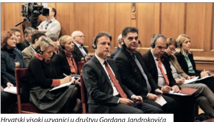
Hrvatski visoki uzvanici u društvu Gordana Jandrokovića