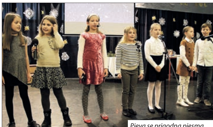
Pjeva se prigodna pjesma.