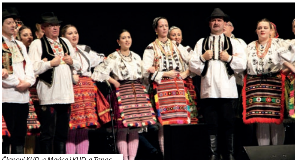
Članovi KUD-a Marica i KUD-a Tanac