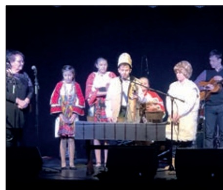
III. Božićni koncert u Podravini