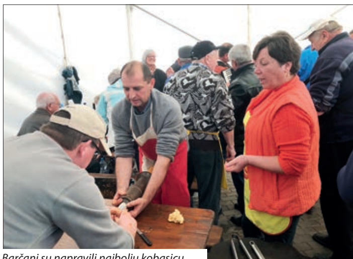
Barčani su napravili najbolju kobasicu.