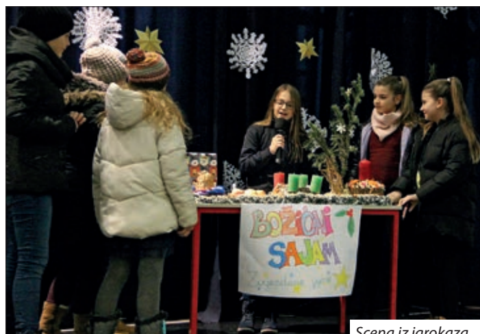
Scena iz igrokaza