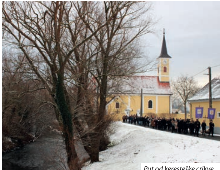
Put od keresteške crkve