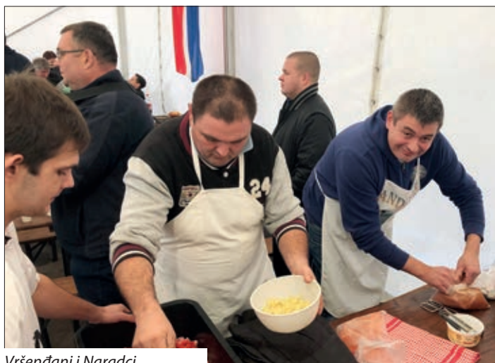
Vršendani i Naradci