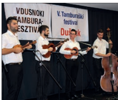
5. tamburaški festival u Dušniku