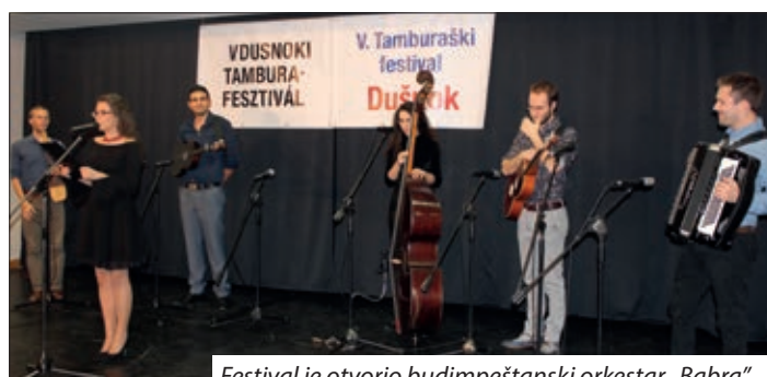
Festival je otvorio budimpeštanski orkestar „Babra“.