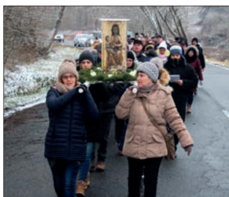
Celjanska Madona zašla u Hrvatske Šice