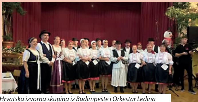
Hrvatska izvorna skupina iz Budimpešte i Orkestar Ledina

slavljene su materice i oci, blagdan bunjevačkih majka i očeva. Već po običaju, gosti su dočekani uobičajenim blagdanskim stolom s orasima, češnjakom, medom i medenom rakijom.