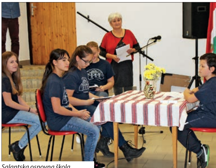
Salantska osnovna škola