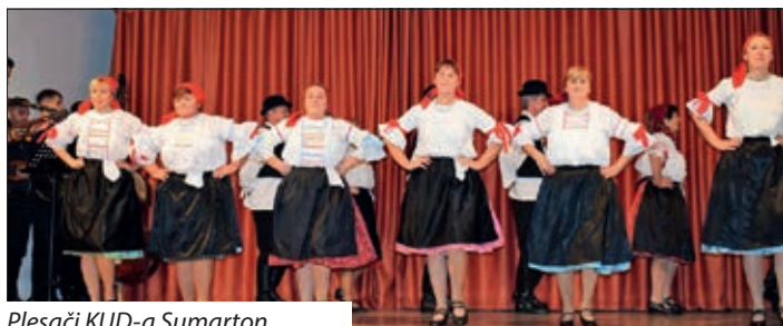
Plesači KUD-a Sumarton