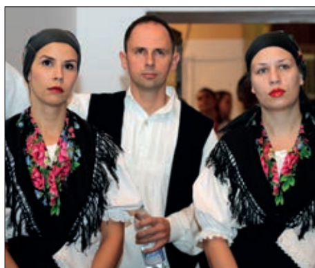
Židanski Hrvatski večer