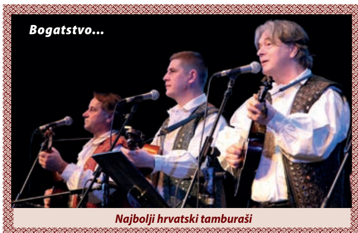
Najbolji hrvatski tamburaši