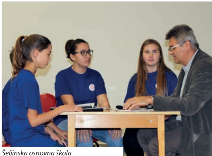
Šeljinska osnovna škola