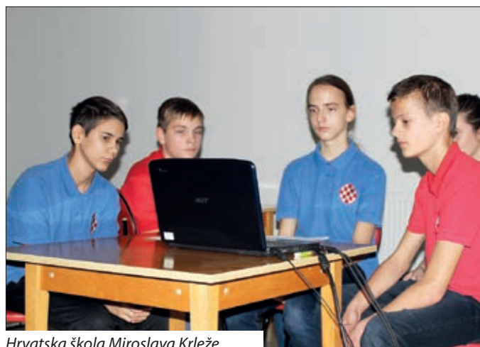
Hrvatska škola Miroslava Krleže