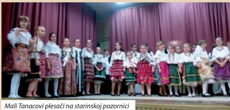
Mali Tanacovi plesači na starinskoj pozornici