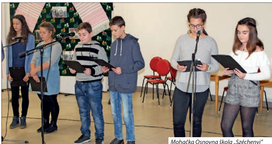
Mohačka Osnovna škola „Széchenyi“