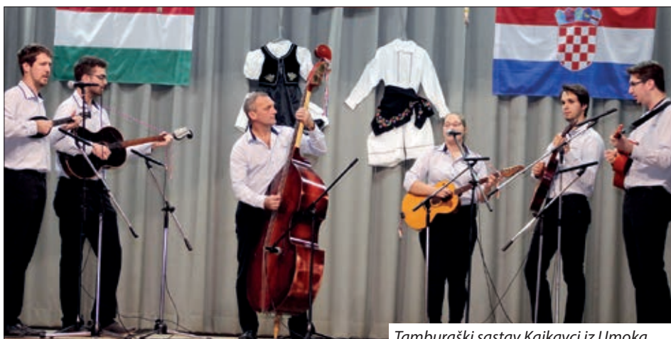
Tamburaški sastav Kajkavci iz Umoka