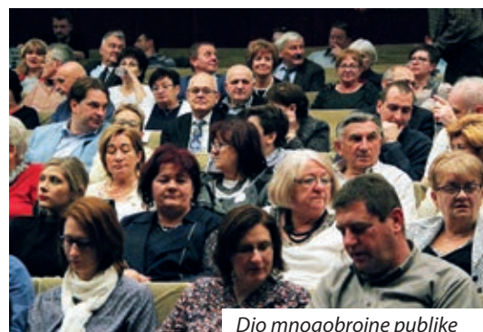
Dio mnogobrojne publike