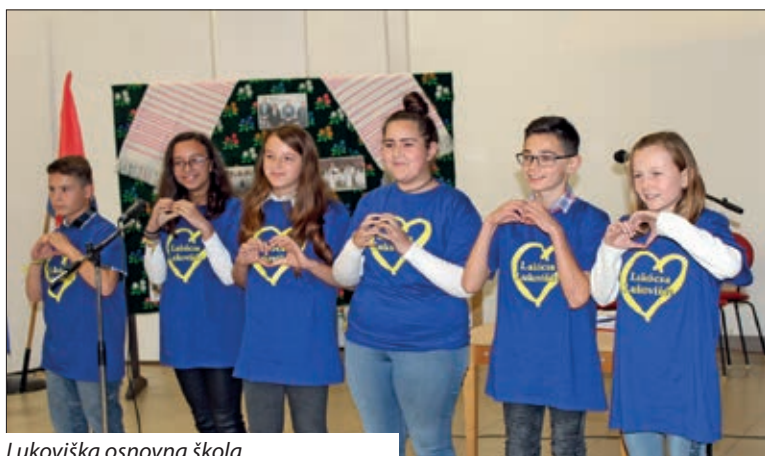
Lukoviška osnovna škola