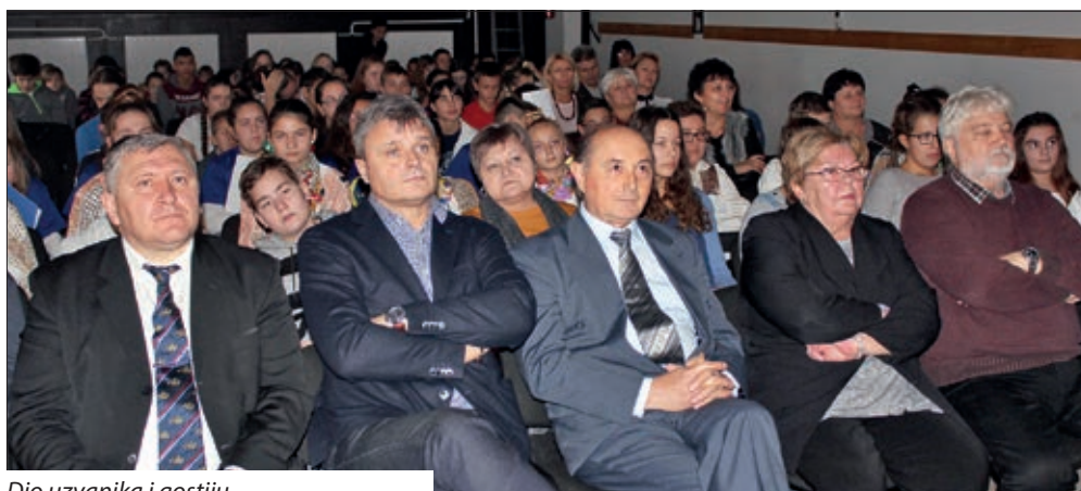
Dio uzvanika i gostiju

Predstavljanje su zaključili učenici Santovačke hrvatske škole, koji su svoj nastup uljepšali plesom i pjesmom, te dočarali ugođaj s Marindanskog bala.