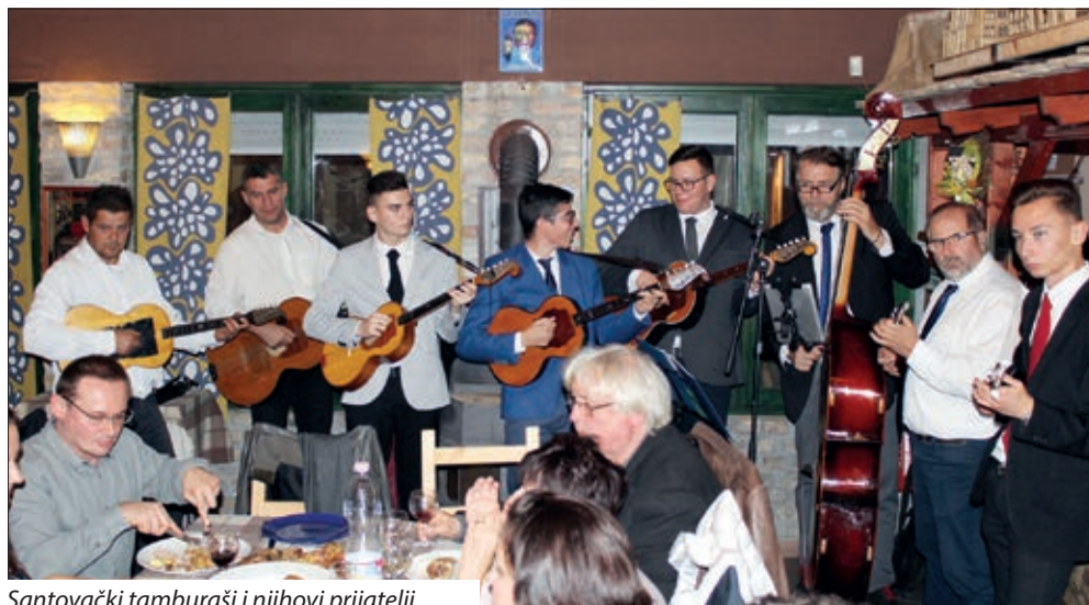
Santovački tamburaši i njihovi prijatelji.