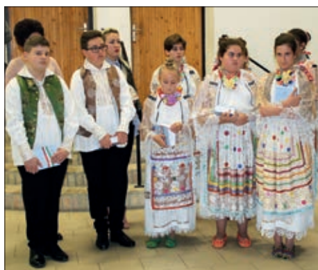
Izlaganje projektnih tema