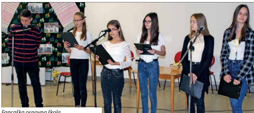
Fančaška osnovna škola