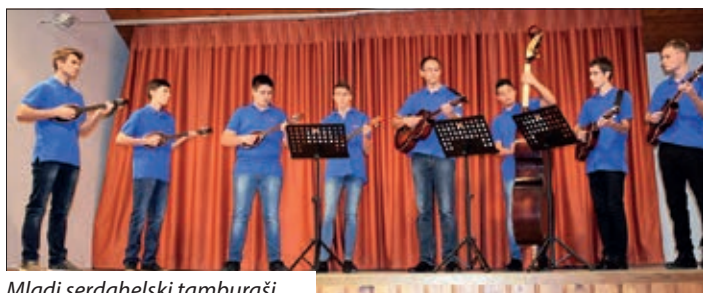
Mladi serdahelski tamburaši