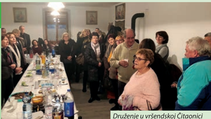
Druženje u vršendskoj Čitaonici

djeluje od 1997. godine. Njeguje klasičnu i tradicionalnu zborSKU glazbu, znamenitih inozemnih i domaćih autora, te manje izvođena i pomalo zaboravljena djela svih glazbenih stihova i epoha. Lani je Zbor bilježio 20 godina svog osnutka. Zbor je u dva navrata proglašen najboljim zborom Zagrebačke županije, a na Međunarodnim susretima pjevačkih zborova u Tuhlju i Karlovcu u nabožnoj kategoriji osvaja zlatno i srebrno odličje. Nakon koncerta, u tamošnjoj Zavičajnoj kući organizatori su dočekali Zbor i pozvane goste na prijam, kolače i sok. Na prijmu su članovi Zbora zapjevali skupa s mještanima i pozvanim gostima, tako je adventski ugođaj svakoga očarao.