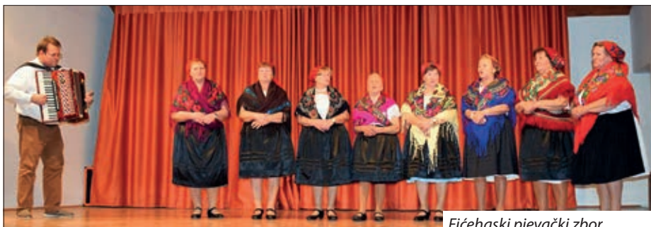
Fičehaski pjevački zbor