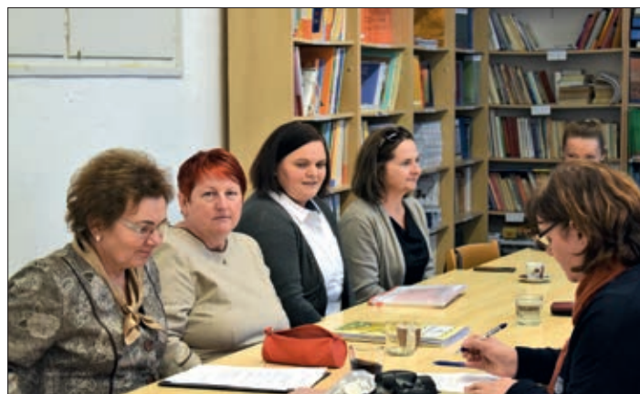
Sudionici Javne tribine

Glasnogovornik Solga ponudio je svoju pomoć svakoj samoupravi, izvijestio je nazočne o tome da prema trenutnim informacijama mjesni i narodnosni izbori bit će održani u listopadu iduće godine. U mjestima gdje ima 25 popisanih pripadnika iste narodnosti automatski će biti raspisani narodnosni izbori. Povećava se i broj zastupnika mjesnih narodnosnih samouprava. Glasnogovornik je član Pripremnog odbora za promjenu i dopunu zakona za narodnosna prava pri Narodnosnom odboru mađar-