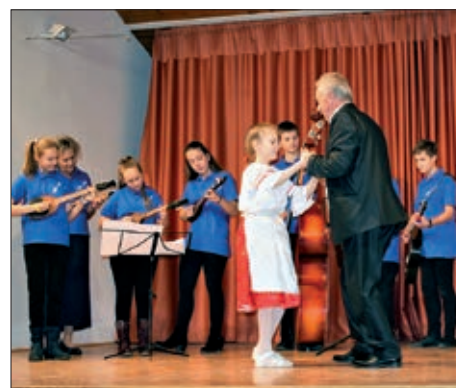
XII. Susret hrvatskih pomurskih zborova