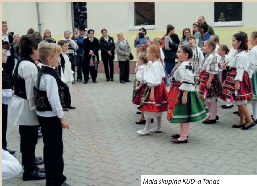
Mala skupina KUD-a Tanac