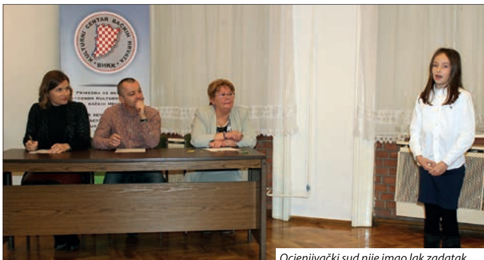
Ocjenjivački sud nije imao lak zadatak.