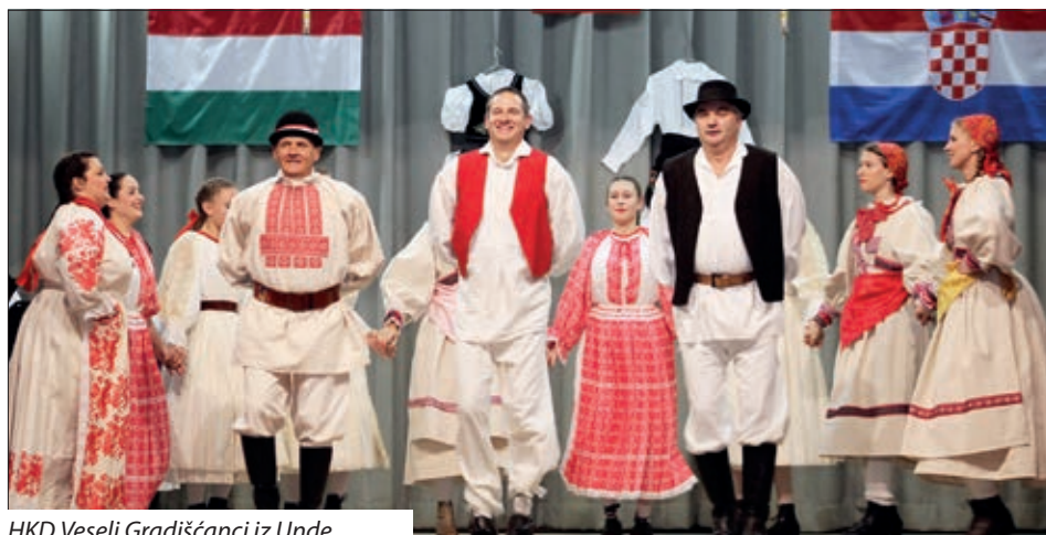
HKD Veseli Gradišćanci iz Unde