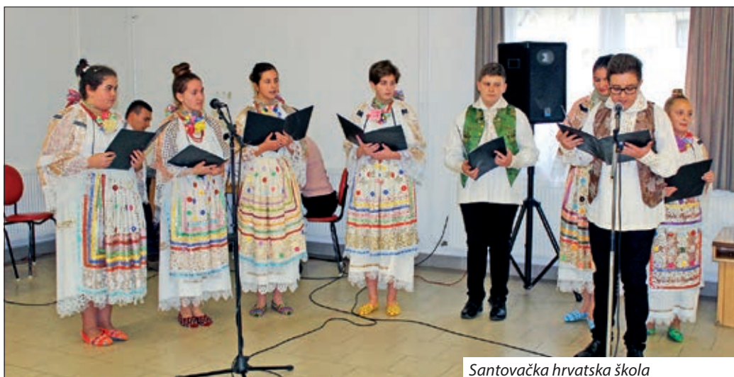
Santovačka hrvatska škola

Učeničke družine na razne načine obradile su i predstavile rad hrvatskih samouprava u svome mjestu, putem govornog izlaganja, projekcije, kazivanja stihova, snimljenih razgovora, ali i razgovora uživo, s mnogo fotografija pa i filmskih zapisa.