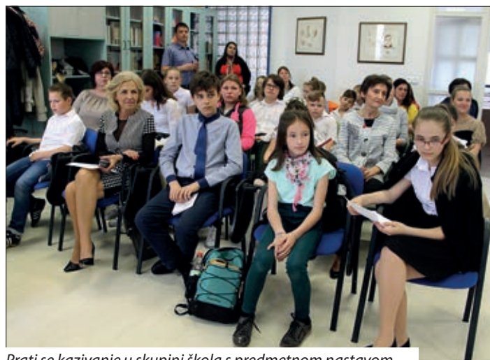
Prati se kazivanje u skupini škola s predmetnom nastavom...