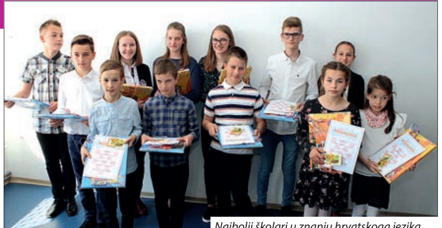
Najbolji školarov u znanju hrvatskoga jezika