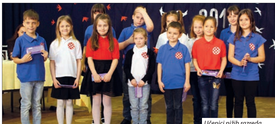
Učenci nižih razreda