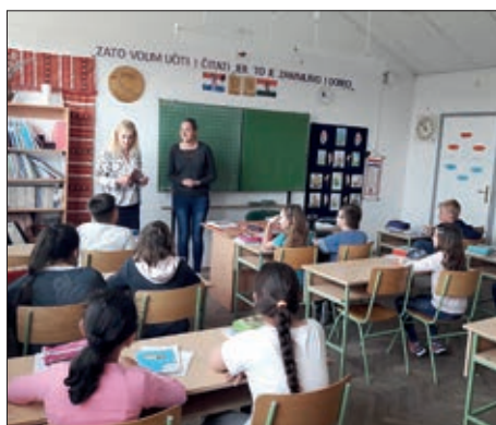
U šeljinskoj školi