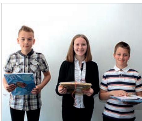
Jezično naticanje gradišćanskih školarov 17. stranica