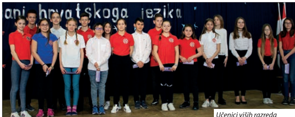
Učenci viših razreda