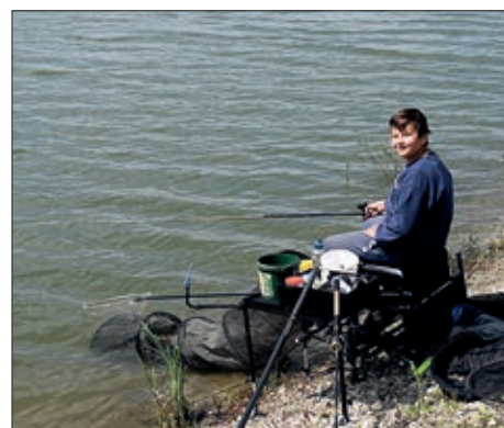
Na serdahelskoj šoderici