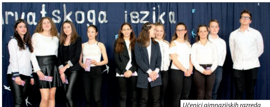
Učenci gimnazijskih razreda

i vještiji, zasigurno i stoga što u njima nema tolike treme u odnosu na učenike 3. i 4. razreda koji su već odrasliji, a time i s većom tremom. Ocjenjivalo se naglašavanje, dužinu pjesme, način kazivanja, uživanje, izgovaranje glasova č, ć, lj, r i je li razumiju ono što kazuju. Kako kaže, dojam je da većina razumije riječi koje su