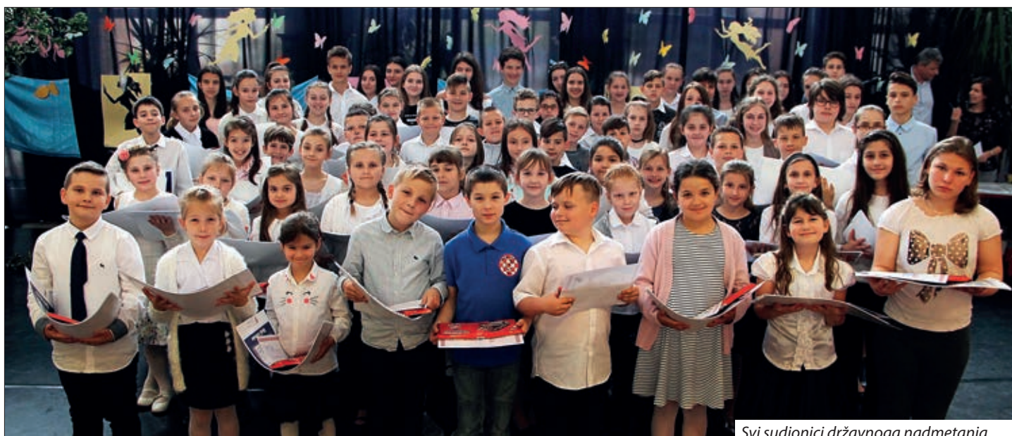
Svi sudionici državnoga nadmetanja