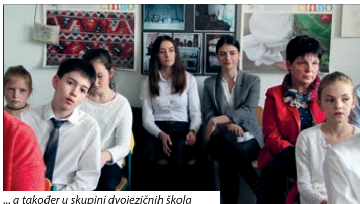
... a također u skupini dvojezičnih škola