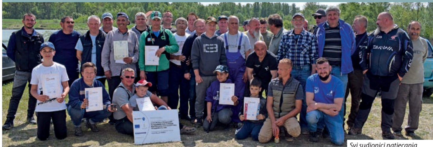
Svi sudionici natjecanja

Po staroj navadi, Ribolovno društvo Serdahel 1. svibnja, Dan rada, proslavlja Međunarodnim natjecanjem u ribolovu. Tako je bilo i ove godine kada se na III. šljunčari serdahelske Samouprave okupilo čak 49 ribiča iz okolnih mjesta: Letinje, Kerestura, Kaniže, Mlinaraca, Semeninca, Sumartona, Serdahela te onkraj granice, iz Goričana i Hodošana da iskušaju sreću u tome sportu.