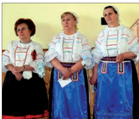
Predsmotra Međimurske popevke