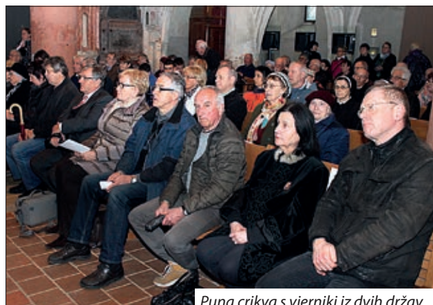
Puna crkva s vjerniki iz dvih država