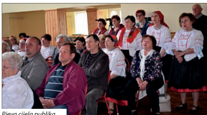
Pjeva cijela publika.