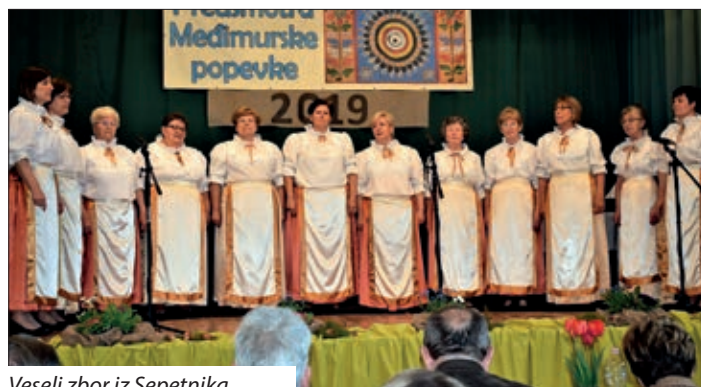
Veseli zbor iz Sepetnika