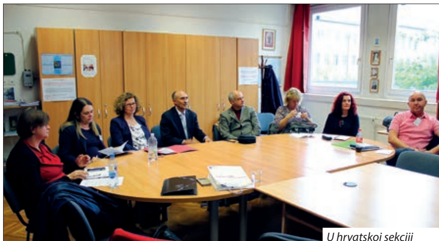
U hrvatskoj sekciji

U organizaciji Instituta za izobrazbu pedagoga na Visokoj školi Józsefa Eötvösa u Baji, 11.-12. travnja održan je X. Međunarodni znanstveno-metodički skup koji se priređuje svakih pet godina. Spomen-sjednicom obilježena je i 150. obljetnica izobrazbe učitelja, odnosno bajske učiteljske škole koja je utemeljena 1870. godine, a od 1984. nosi ime Józsefa Eötvösa. Od samih početaka u ovoj se ustanovi odvija izobrazba njemačkih i hrvatskih narodnosnih učitelja, a od 1989. i odgojitelja.