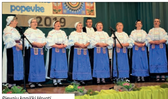
Pjevaju kaniški Hrvati.