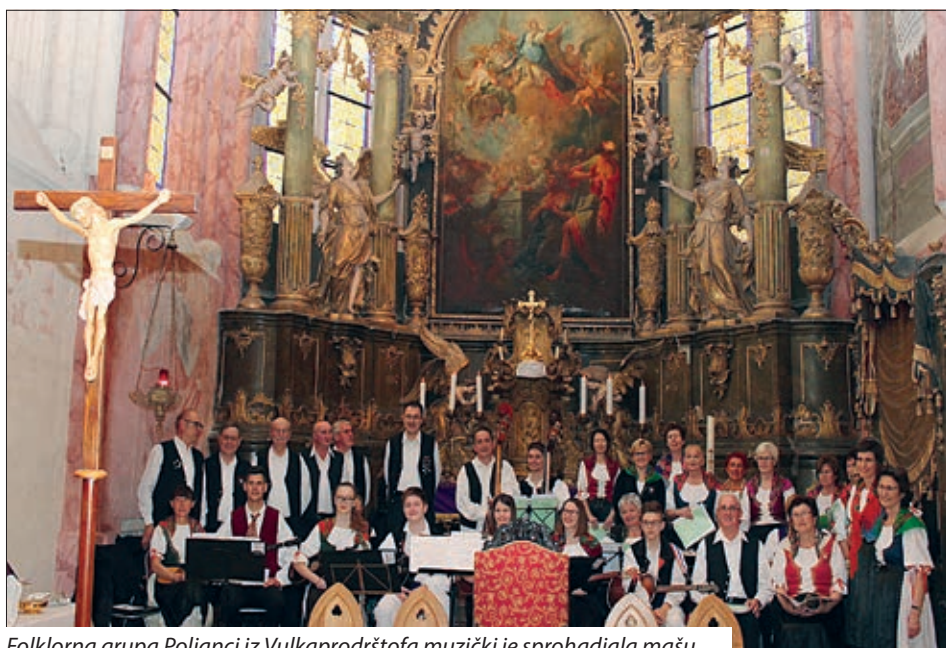
Folklorna grupa Poljanci iz Vulkaprodrštofa muzički je sprohadjala mašu.

su njegovo tijelo ekshumirali i prevezli u fileški cimitor, kade su ga svečano odspohodili na zadnji počivak, pod peljanjem jurskoga biskupa Antala Fetsera. Sto ljet kasnije u šopronskoj Ulici Kristófa Lacknera pod brojem 7, jurski biskup dr. András Veres je blagoslovio spomen-ploču iz granita, ku je dala postaviti Familija Kornfeind-Semeliker uz pomoć Hrvatske samouprave Šoprona. Pri trojezičnoj ploči uz himnu Gradišćanskih Hrvatov i marijansku himnu hrvatskoga naroda, brojni skupaspravni dvih država su se i pomolili, pod peljanjem patera Anijana Marka Mogyorósija, voditelja Hrvatske sekcije u Jurskoj biskupiji. Duhovnik Ivan Karall se je spomenuo u svojem svečanom govoru na pokojnoga i je istaknuo: „Ova spomen-ploča neka stoji ovde za buduće generacije, ke projdu mimo, da prestanu i spomenu se, kako je bilo vrime, kad je jedna ideologija prez Boga i vjere zavlada.“ Kako je još rečeno, Anton Semeliker, rođen iz Vulkaprodrštofa, bio je pravi pastir svojim vjernikom u Filežu. Zvana