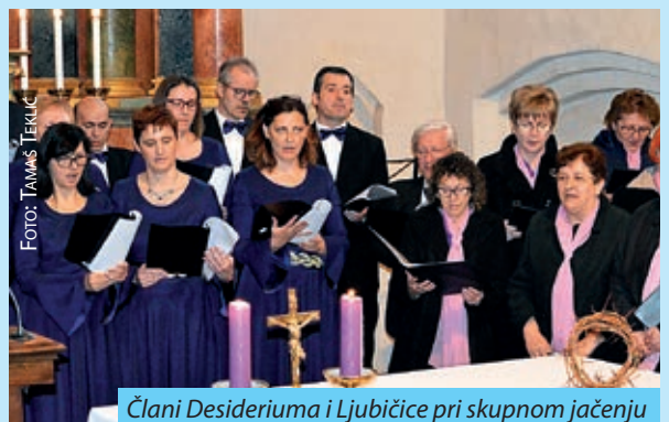
Člani Desideriuma i Ljubičice pri skupnom jačenju