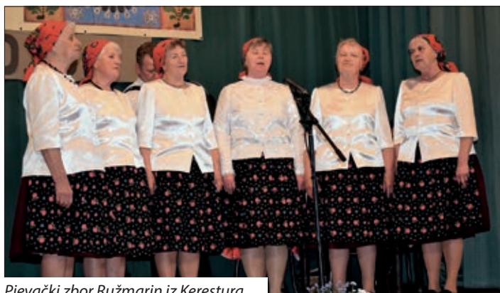
Pjevački zbor Ružmarin iz Kerestura