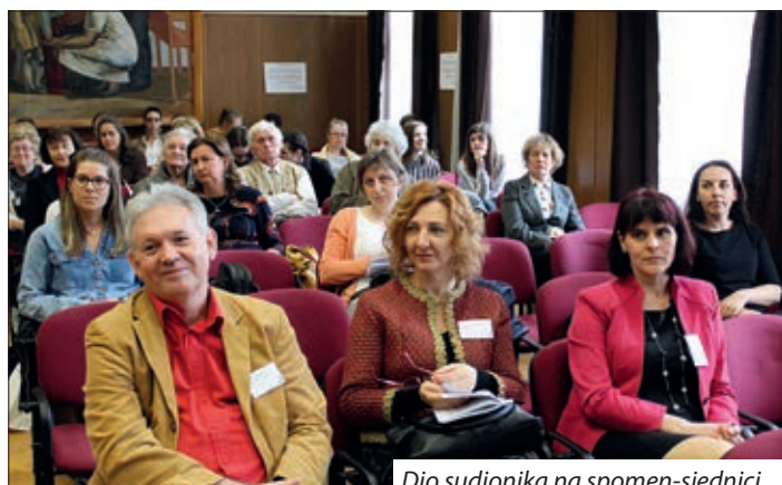
Dio sudionika na spomen-sjednici