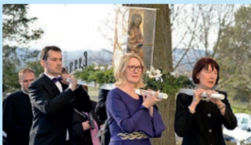
Na prošeciji su štatuu nosili jačkari i jačkarice zborov