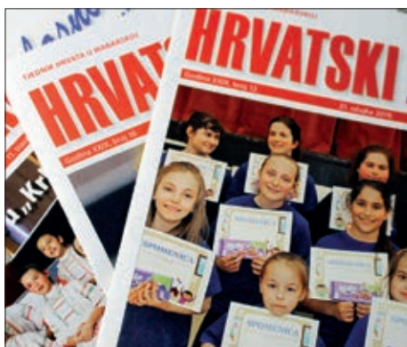
Dan hrvatskog tiska