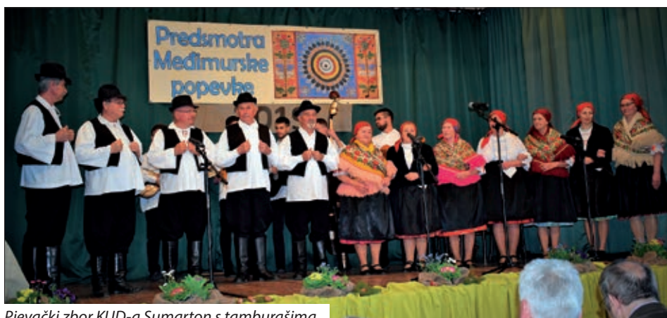
Pjevački zbor KUD-a Sumarton s tamburašima

motivima, melodiji i jeziku uglavnom jednake onima u donjomeđimurskim naseljima, što potvrđuje činjenicu zajedničkih korijena Hrvata s jedne i druge strane granice. Pomurski su Hrvati već od 1976. godine nastupili na Smotri u Nedelišću (Kulturno društvo Mura iz Serdahela, Kulturno društvo iz Sumartona), ali veće sudjelovanje postignuto je organiziranjem predsmotra u Pomurju, na kojima se još uvijek nađu novi napjevi i tekstovi. Ugled međimurske popijevke u zadnjim je godinama porastao, 2013. upisana je u Registar kulturnih dobara Republike Hrvatske, a lani dospjela i na UNESCO-ov reprezentativni