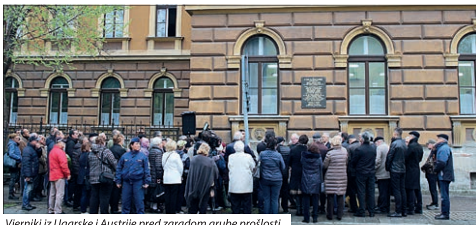
Vjerniki iz Ugarske i Austrije pred zgradom grube prošlosti