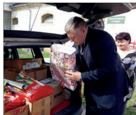
Pokloni za lukovišku i starinsku školu