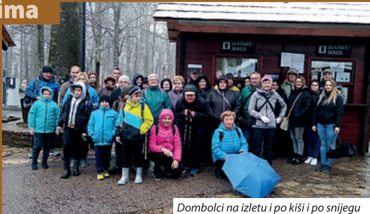
Dombolci na izletu i po kiši i po snijegu