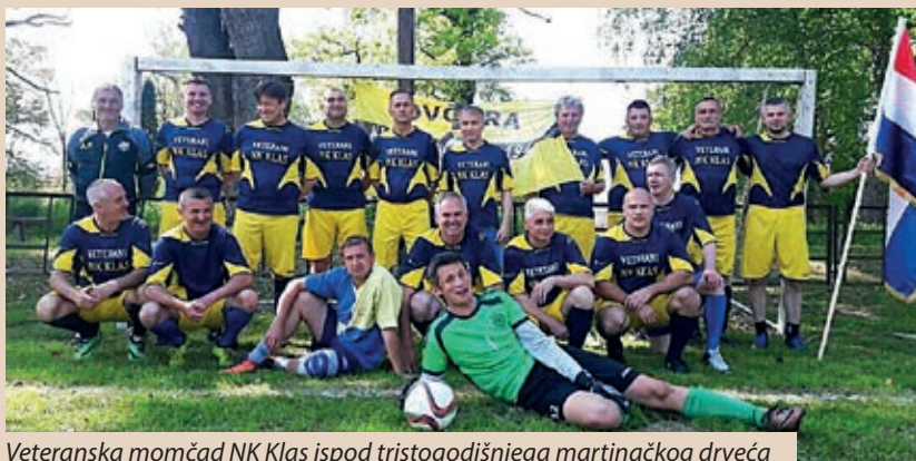
Veteranska momčad NK Klas ispod tristogodišnjega martinačkog drveća