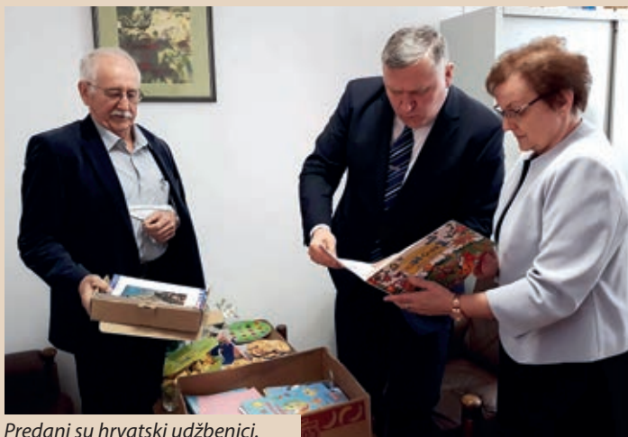
Predani su hrvatski udžbenici.