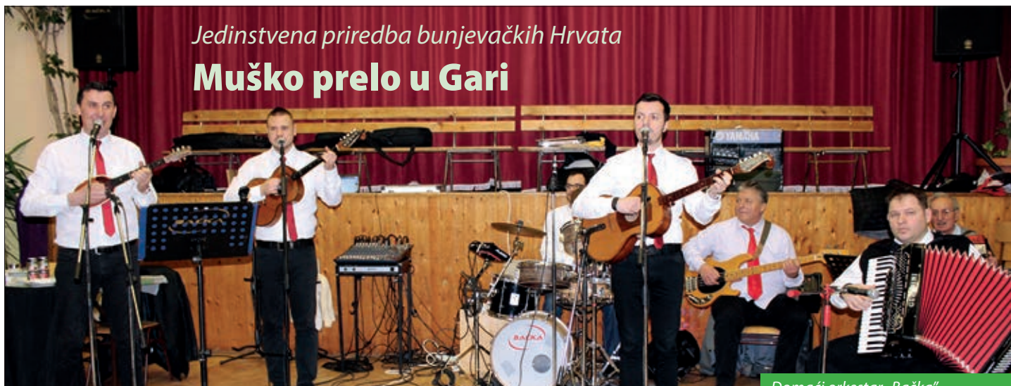
Domaći orkestar „Bačka“

Hrvatska samouprava sela Gare 3. ožujka organizirala je već tradicionalno Muško prelo, jedinstvenu zabavu bunjevačkih Hrvata. Unatoč snježnu nevremenu, u mjesnom domu kulture okupilo se umalo dvjesto gostiju iz Gare i okolnih naselja, ali i prekograničnih prijateljskih naselja. Za večeru pripremljen je uobičajeni ovčji paprikaš, a u šest velikih kotlova kuhalo se šest ovaca, ukupno 120 kilograma ovčjeg mesa. Za večeru pobrinulo se šest kuhara i dva organizatora. Izvrsni ovčji paprikaš zaliven je još izvrsnijom kapljicom vina jer, kako reče jedan od organizatora i sudionika, na Muškom prelu uz ovčji paprikaš „sve se pije što ne triba grist!“