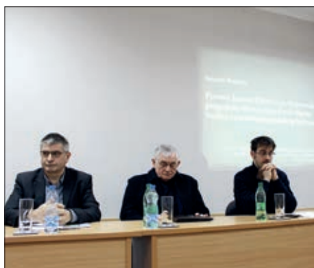
Kolokvij o biskupu Pavlu Sučiću