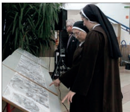
VI. Pasijska baština