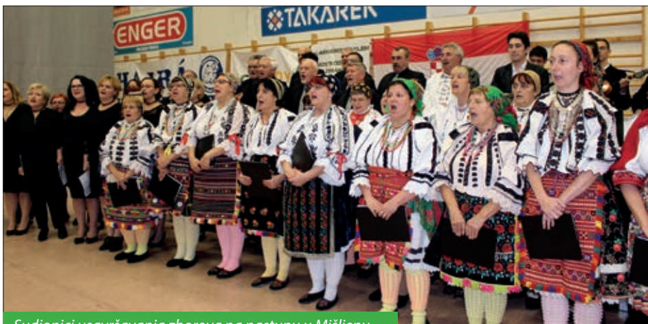
Sudionici usavršavanja zborova na nastupu u Mišljenju

Prema planu rada i programa za 2018. Godinu, organizirat će ili suorganizirati ove priredbe: Gostovanje dubrovačkog KUD-a „Lindó“ 24. ožujka u Mohaču, a 25. u Salanti, 4. travnja glavna proba pjevačkih zborova u Vršendi za nastup u osječkom Hrvatskom narodnom kazalištu