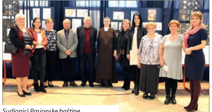
Sudionici Pasionke baštine