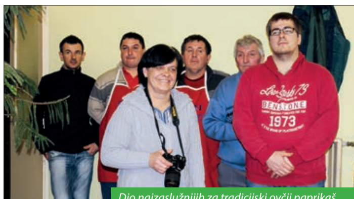
Dio najzaslužnijih za tradicijski ovčji paprikaš

Tijekom večeri na muškoj zabavi, koja uz bunjevačke Hrvate okuplja i pripadnike drugih narodnosti, za dobro raspoloženje i ove se godine pobrinuo domaći Orkestar „Bačka“ koji je, već po navadi, Muško prelo otvorio bunjevačkom himnom „Kolo igra, tamburica svira“, a njima su se pjevanjem pridružili i brojni sudionici.