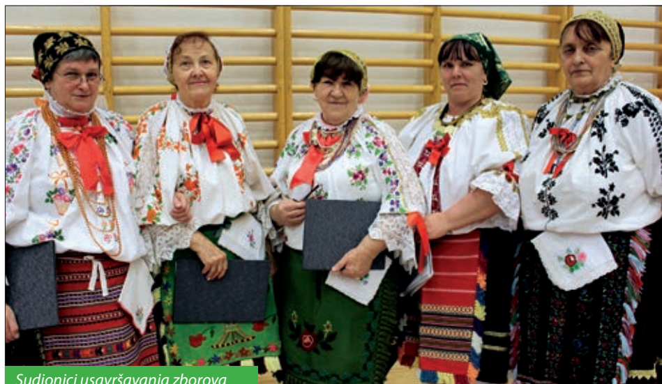
Sudionici usavršavanja zborova