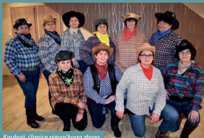
Kauboji, članice pjevačkoga zbora

Hrvatska samouprava sela Pustare prije deset godina započela je priređivanje Pomorskog fašnika, kako bi oživila taj stari običaj i nudila priliku za druženje pomurskoj hrvatskoj zajednici. Ove je godine Fašnik održan 9. veljače nešto skromnije, naime zbog mnoštva događanja, ovaj put nisu stigle družine iz drugih mjesta. „Pustarčice“ i „Pustarčani“ potražili su doma staru odjeću, maskirali lice i krenuli u povorku pjevajući, huškajući. Članice Pjevačkoga zbora „Biseri Pustare“ obukle su se u kauboje i pripremile se s veselim suvremenim kaubojskim plesom. Kod novopredane seoske krušne peći okupilo se mnoštvo mještana, gdje su se dijelile ukusne kobasice, gibanice i pokladnice (krafne) za sve sudionike fašničkog veselja. Pustarski načelnik Laci Prekšen pozdravio je okupljene, zahvalio je hrvatskoj samoupravi na organizaciji i pozvao sve okupljene da s veseljem otjeraju zimu.