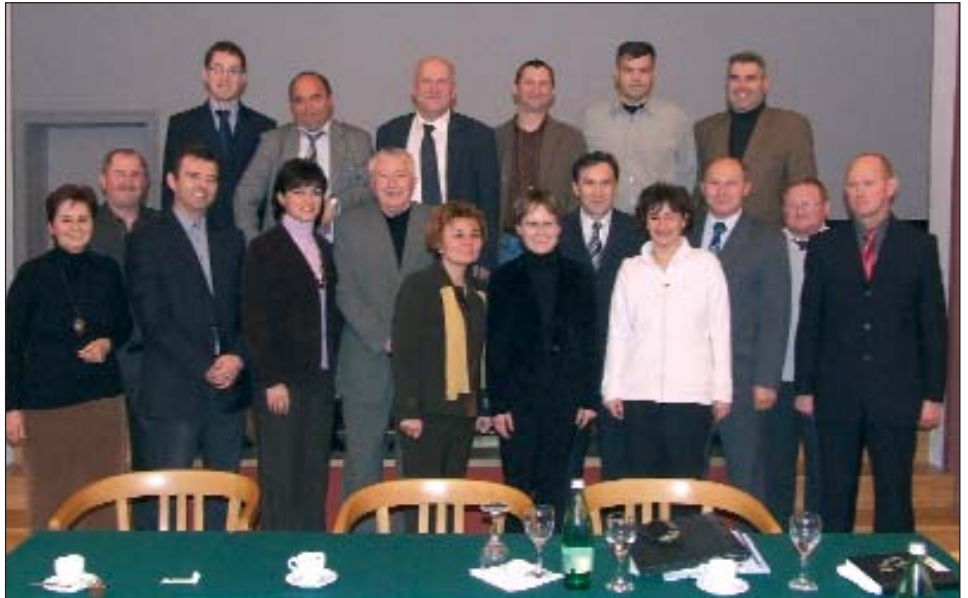
Članovi Mješovitog odbora

U rujnu predsjednik se sio s parlamentarnim zastupnikom Mátyásem Eörsiem, koji se interesirao za prekograničnu suradnju.