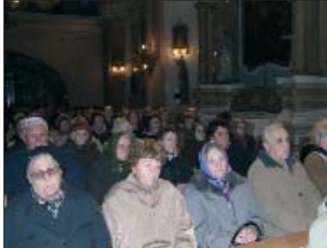
Crkva je bila ispunjena hrvatskim vjernicima

Iako je u Baji i prije bilo prigodnih okupljanja za Božić i oko njega, proslavljale su se Materice i Oci, blagdan bunjevačkih majka i očeva, prvi put organizirana je velika kulturno-zabavna i vjerska priredba za cijelu hrvatsku zajednicu u Bačkoj. U suorganizaciji Saveza Hrvata u Mađarskoj, bačkog ogranka SHM-a i Županijske hrvatske samouprave, u subotu, 8. prosinca, u Baji je održan Božićni program koji je okupio bačke Hrvate na izložbi bačkih slikara, na hrvatskoj misi i cjelovečernjem koncertu.