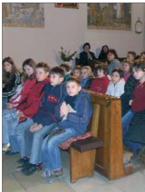
Polaznici vjeronauka, učenici hrvatske škole, sva tri dana u velikom broju sudjelovali su na duhovnoj pripravi