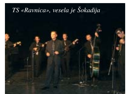
TS «Ravnica», vesela je Šokadija