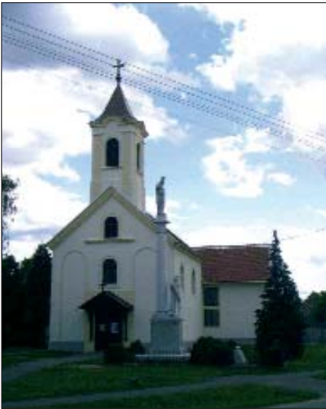
Kapela sv. Štefana u Petrovom Selu