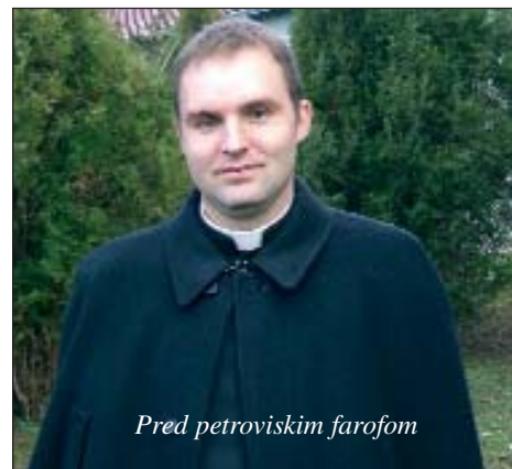
Pred petrovskim farofom

Advent – to je poželjno vrime čekanja, ali ov veselja pun čas projde danas u nekakov nepotriban sjaj. U onom starom vrimenu ovo je bilo dob za pokoru, post. U naši srci mora zavladati štimung pripreme, čekanja ter se svisno moramo pripravljati na doček