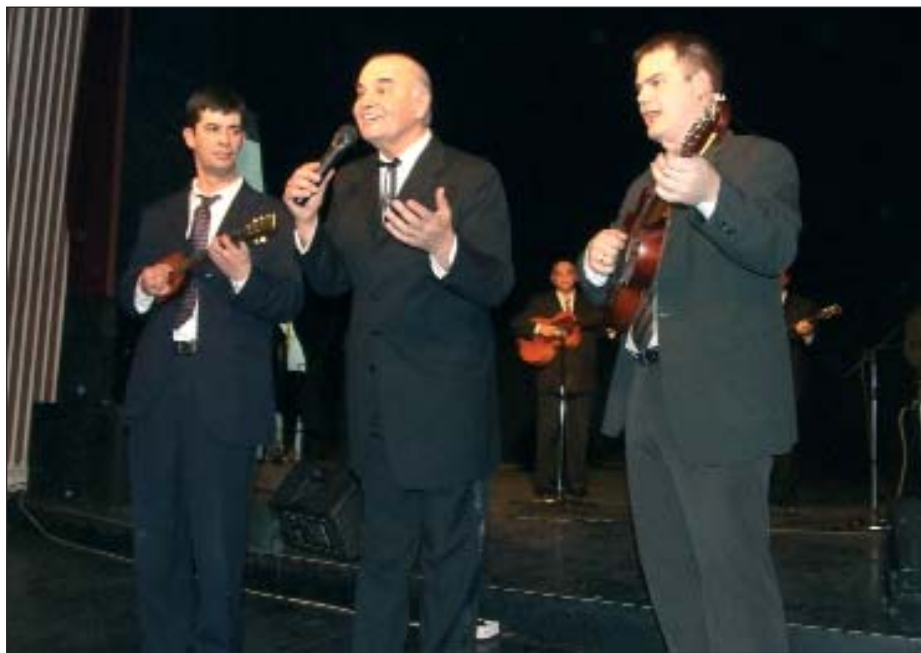
Zvonko Bogdan s dva tamburaša svog orkestra na Božićnom koncertu u Baji