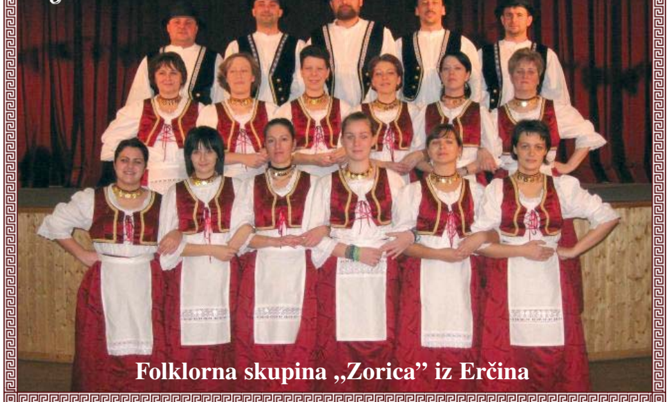
Folklorna skupina „Zorica” iz Erčina