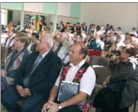
Na program su došli Hrvati iz grada i cijele okolice