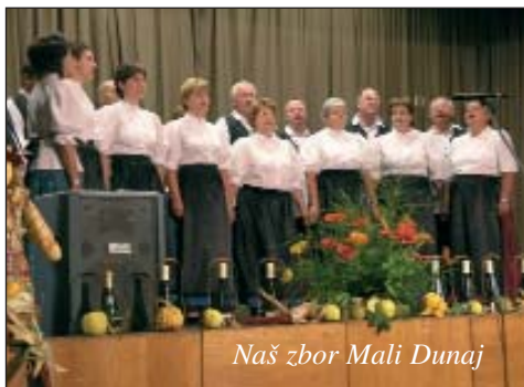
Naš zbor Mali Dunaj