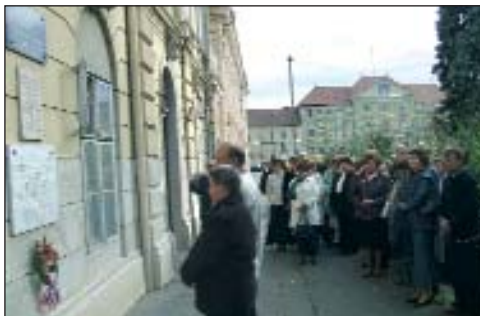
Vijenac su položili zastupnici Hrvatskoga kulturnoga i vjerskoga društva u Sambotelu ter gradske Hrvatske manjinske samouprave

Bojsek rijetko se zgoda da pred sambotelskom katedralom se začuje hrvatska himna, no prošle subote s Lijepom našom je započeta spomin-svetačnost hrvatskoga bana i pjesnika Ivana Mažuranića. U Ulici Jánoša Szilya pod brojem 4, je jedno ljeto (1834/1835) studirao spomenuti velikan. Njemu u čast je pred dvimi ljeti otkrilo spomin-ploču Hrvatsko kulturno i vjersko društvo u Sambotelu. Kao jedan od inicijatorov postavljenja te mramorne ploče, a i sadašnji glavni organizator ovoga programa Vince Hergović, plajgorski načelnik, ujedno i član spomenutoga društva, je 13. oktobra (subota) otpodne je govorio o Mažuraniću, saborskom zastupniku, dvorskomu kancelaru, istaknuo je njegovu važnost u jačanju hrvatske autonomije, a nije zabio spomenuti reformera uprave, sudstva i školstva ter rodoljuba i pjesnika, ilirca. Vijenac su pred zgradom položili zastupnici spomenutoga Društva ter peljači gradske Hrvatske manjinske samouprave. S gradišćanskom himnom su zbogom dali pozvani gosti ovom važnom mjestu u žitku sambotelskih Hrvatov, potom su nastavili put u Kisfaludyevu ulicu, kade je u nastavku jesenskoga festivala slijedilo kulturno otpodne s brojnim hrvatskimi grupami, skoro iz svakoga našega sela Željezne županije. Uglavnom jačkarno spravišće je otvorio sambotelski Zbor „Sv. Cecilija“, za njimi su došli kiseški svirači i pjevači „Zore“. Za petrovskom „Ljubićicom“ je došla Ulici