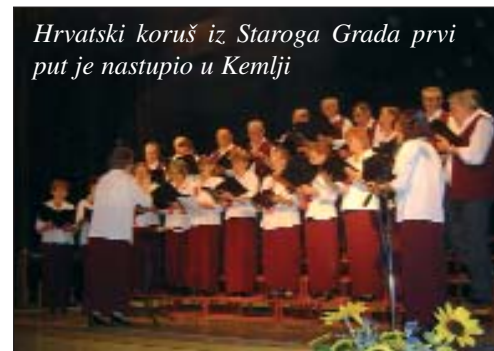
Hrvatski koruš iz Staroga Grada prvi put je nastupio u Kemlji