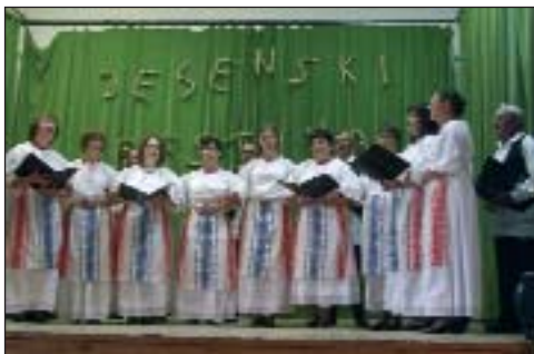
„Slavuj“ iz Hrvatskih Šić