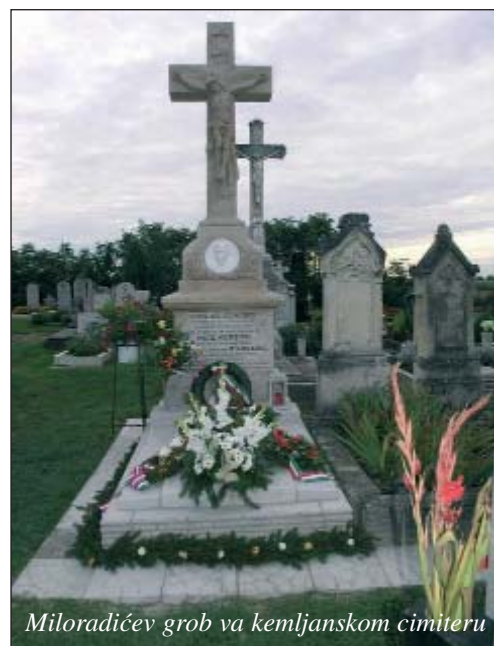
Miloradićev grob va kemljanskom cimiteru

Septembar je ta misec kad imamo čuda programov, ali najveći je svenek naš Hrvatski dan u Kemlji. Mogli biste pitati zač imamo ta svetak u septembru? Osamnaestoga septembra se je narodio Mate Meršić-Miloradić, i svako ljeto oko toga dana svečujemo. Njega čuvamo u spominki, imamo u školi Zakladu Mate Meršića-Miloradića, i jačkarni zbor nosi njegovo ime, a u selu je otvorena i Miloradićeva ulica. Njegov spomenik stoji pri crikvi i svako ljeto položimo vijenac, tako smo i ovput imali mali program u cimiteru. Molili smo i jačili pri grobu, koji je lani obnovljen. I ljetošnji dan je bio lip, sunce je svitilo, teplo je bilo. Goste smo čekali va Hrvatskom klubu, došli su iz Čeprega, Hrvatskoga Jandrofa (Slovačke) ter iz Staroga Grada. Kad smo svi skupadošli, išli smo va cimiter. Na programi u kulturnom domu nisu nastupali samo gosti, nek i naše domaće grupe. Dica iz čuvarnice su nam pokazala šareni program. No kad smo čuli jandrofski muški zbor i njeve tamburaše, nas je srce jako zabolilo.