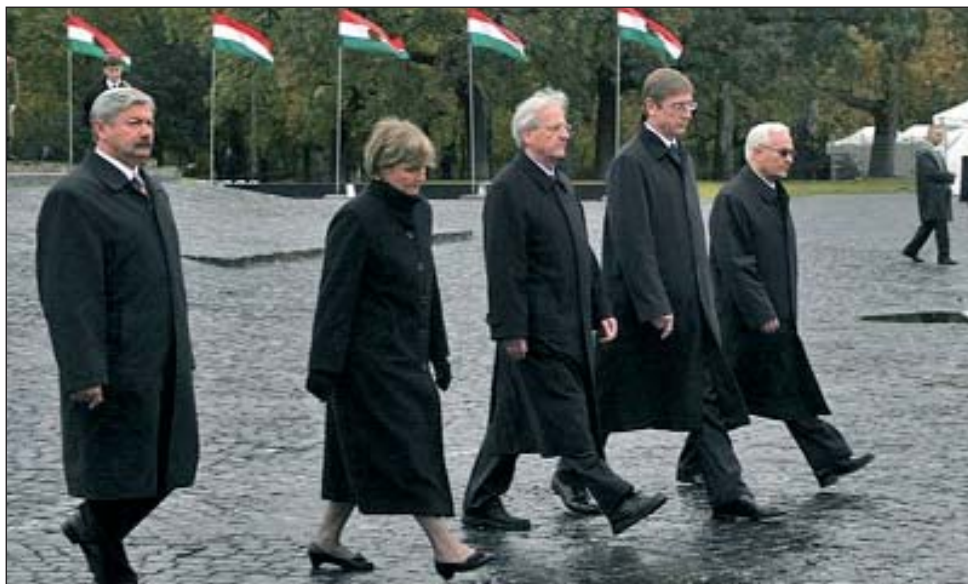
Visoki dužnosnici Republike Mađarske i Vlade 23. listopada odaju spomen Revoluciji iz 1956. godine