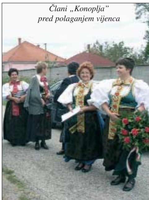
Člani „Konoplja” pred polaganjem vijenca